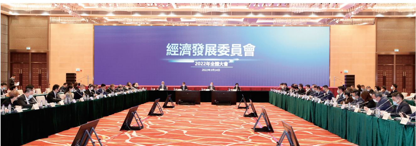
行政長官賀一誠主持經濟發展委員會2022年全體大會

會上多位委員對推動澳門經濟發展踴躍提出建議，行政長官亦寄語希望所有委員，今後繼續群策群力，共同為推動澳門的經濟發展出謀獻策，提供寶貴的意見。