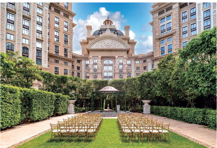
綠茵勝境花園景色優美，歐式庭園景致如畫，簇擁上葡京宏偉壯闊的建築群，適合舉辦西式婚禮。