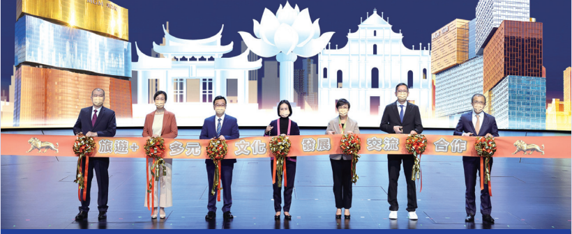
美高梅與旅遊局、澳門旅遊學院及澳門工會聯合總會合辦，澳門烹飪協會支持的「『旅遊+』多元文化發展交流合作計劃」。

強與旅遊局合作，推動行業培訓；其中，旅遊局與美高梅及相關協會亦合作舉辦有關無障礙旅遊、無障礙溝通和文化旅遊的講座、工作坊及線上課程。今年，旅遊局繼續擴客源的各項工作，深化『旅遊+』跨界融合，以促進社區經濟，同時加強粵港澳大灣區和琴澳旅遊合作等。希望業界不斷自我增值並發揮創新思維，強化公私營合作，推廣澳門安全宜遊的形象，吸引更多旅客來澳門，推動旅遊業復甦。」