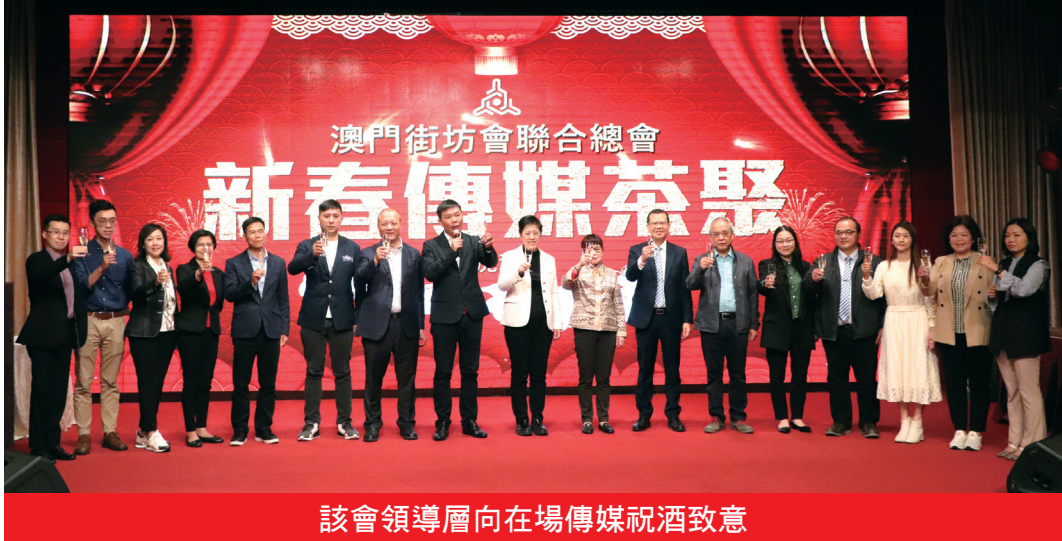
該會領導層向在場傳媒祝酒致意

人次突破311萬，同比增長9.89%；跟進及處理個案逾8,000宗，同比增長17.88%。在社區工作方面，針對不同的社會問題，進行了多項調查，深入了解居民的需求及訴求，並向特區政府反映及提出有關建議。