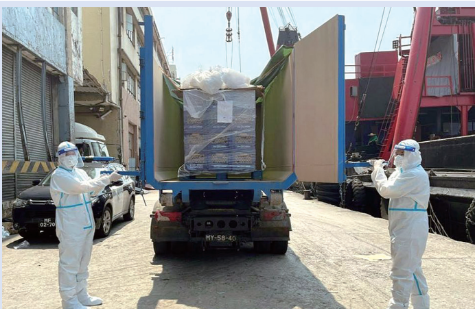
是次在外包裝膠膜被檢出新型冠狀病毒核酸呈陽性的樣本，涉及一板乳酪產品合共24膠箱，共重201.6公斤，已全數完成銷毀，沒有流入市面。

焦點新聞 近日內地多省市爆發新冠疫情，而本澳疫情保持穩定，有賴特區政府嚴防外輸，內推疫苗的 措施。日前，澳門市政署在一批來自香港的奶製品外包裝膠膜樣本上，檢出新冠陽性，市政署即時啟動應急預案，採取追溯排查、複檢等措施，封存涉事產品並全數銷毀，沒有流入市面。特區政府即時有效的措施，成為了防止染有病毒的物品流入澳門的第一道防線。如今澳門臨近地區疫情嚴峻，特區政府在嚴防人員來澳的同時還嚴格加強進口貨物的檢疫，這體現了特區政府對於疫情的立體、綜合防控部署和對澳門市民生命健康安全高度負責。