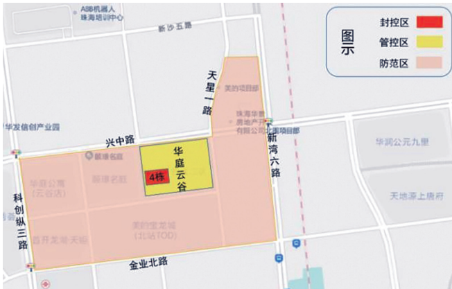
唐家灣鎮星灣社區劃定封控區、管控區、防範區。

教育局舉辦校際歌唱比賽 【本報訊】為鼓勵澳門合唱藝術的發展，促進各學校間的音樂文化交流，從而提高學界的歌唱水平，使學生體會到相互合作的重要性，由教育及青年發展局主辦、亞太教育文化交流協會協辦、中國工商銀行（澳門）股份有限公司獎金贊助的2021/2022學年第三十九屆校際歌唱比賽將於4月9日及10日假澳門大學大學會堂舉行。