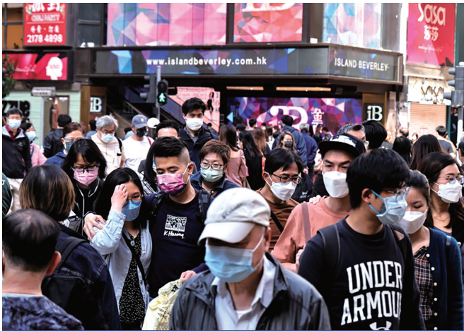
香港第五波疫情累計逾96萬例

香港衛生署衛生防護中心傳染病處主任張竹君日前表示，第五波疫情當中，有超過500名患者屬二次感染，即過往曾於首四波疫情中，曾經被感染。