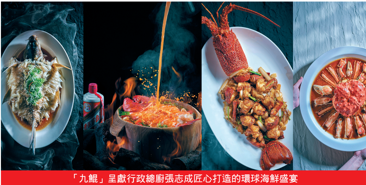
「九鯤」呈獻行政總廚張志成匠心打造的環球海鮮盛宴

深合區管委會常務副主任、澳門特區政府行政法務司司長張永春，管委會副主任、廣東省委常委、常務副省長張虎，管委會副主任、澳門特區政府保安司司長黃少澤，管委會、執委會及省有關部門、相關地市負責人參加會議。