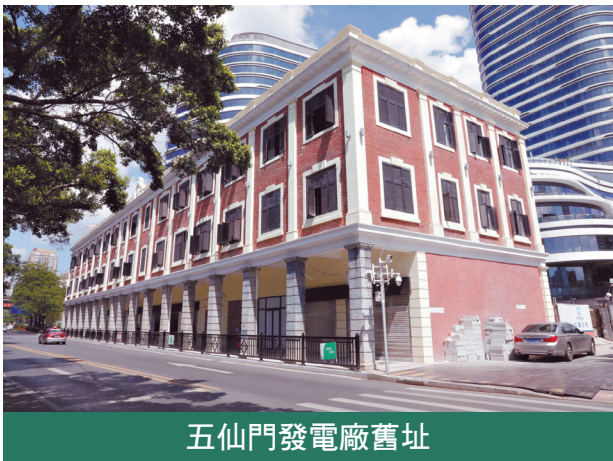
五仙門發電廠舊址

珠江上歷來百舸爭流，中外貿易風生水起。1845年，第一艘來穗的大型鐵殼蒸汽機船——“瑪麗·伍德夫人”號抵達黃埔港。隨船抵達的英國人約翰·柯拜在這裡發現了商機。當時廣州沒有船塢有能耐修理鐵殼蒸汽機船，柯拜在長洲島租了幾個泥船塢，改造成石船塢，人稱“柯拜船塢”。這是內地近代第一座石船塢，標誌著近代船舶修造業的發端。 柯拜船塢的修船和造船業務蒸蒸日上。柯拜之子“子承父業”，成立了“柯拜船塢公司”，於1861年將柯拜船塢擴建成內地最大的石船塢，可供5000噸級的輪船入內修理。後來，小柯拜又與人在附近合資興建錄順船塢。如今，柯拜船塢安於黃埔造船廠內一隅，訴說著廣州修造船業的百年故事。 百餘年前，珠江上貨如輪轉，商人們很快意識到配套倉儲的重要。芳村一帶本是花鄉，近代工業在廣州興起後，這一帶日漸喧嘩。清光緒三十二年（1906年），英國亞細亞火油公司在白鶴洞建設亞細亞龍嘜倉，佔地逾1萬平方米。這是廣州最早建成的儲存工業油料的倉庫。如今，亞細亞火油公司的歐式辦公樓與碼頭舊址就“隱身”於尋常巷陌間。 除了亞細亞龍嘜倉舊址，記者在珠江兩岸還見到日清倉、美孚倉、德士古油庫、渣甸倉、亞細亞花地倉的舊址，以及江對岸的太古倉舊址。它們是在同一時期建造的，見證了廣州成為華南地區最大物流中心的歷史。 蒸汽機來了，緊接著，電燈也來了。1888年，兩廣總督張之洞托人在國外購買了一台發電機。當年7月18日，他在總督衙門（今越華路118號廣東省民政廳址）旁建起一座小型電燈廠。幾天後，總督衙門裡第一次亮起了電燈。廣州成了繼北京之後國內第二個用上電燈的城市。 但電燈在廣州命運多舛。1890年，旅美華僑黃