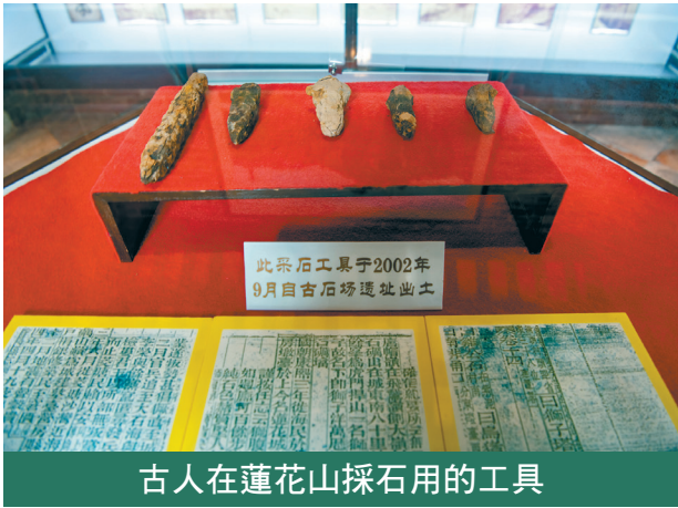
古人在蓮花山採石用的工具

200米的範圍內採石，挖掘深度達13米，平均高度約25米，最高處達40米，取石料約300萬立方米。接著，他們將石材搬上船，從水路運進城，營造宮殿及王陵。 西漢南越王墓被發現後，中國科學院廣州地球化學研究所研究員朱照宇開展碳14同位素檢測，考證得出結論：南越王墓建築石料主要來自蓮花山古採石場，證明了廣州船舶修造業、鑄冶和五金製品業的悠久歷史。