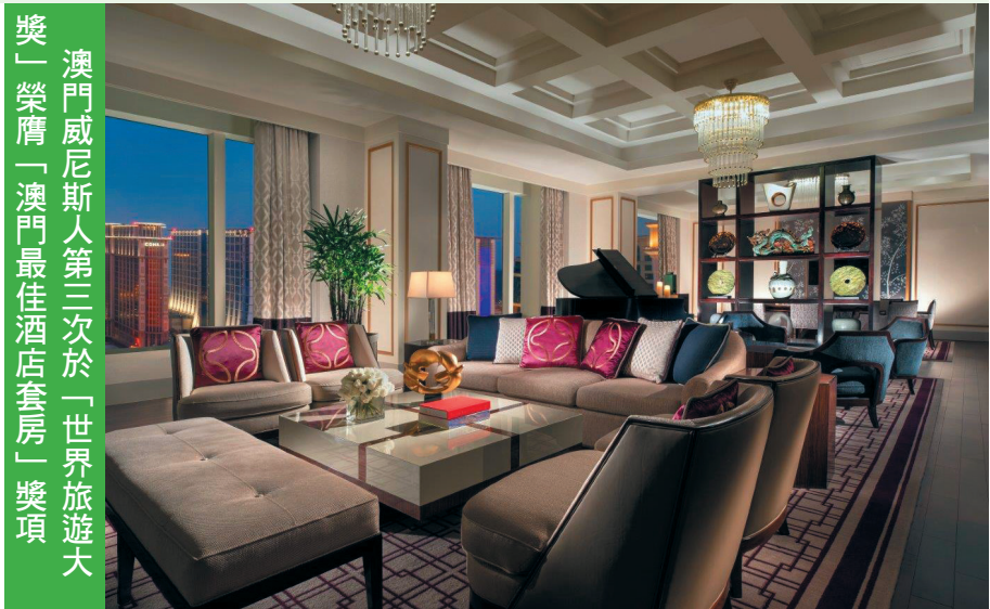
澳門威尼斯人第三次於「世界旅遊大獎」榮膺「澳門最佳酒店套房」獎項

澳門威尼斯人是澳門金沙度假區的一部分。作為澳門首屈一指的綜合度假村，澳門金沙度假區持續致力提升服務及產品水準。