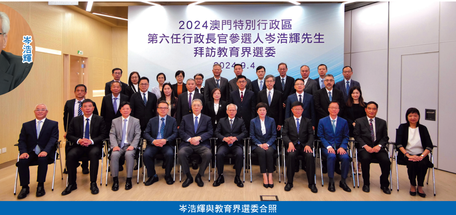
2024澳門特別行政區 第六任行政長官參選人岑浩輝先生 拜訪教育界選委 2024.9.4

焦點新聞 第六任行政長官參選人岑浩輝日前在競選辦公室代理人李煥江、主任葉兆佳、副主任陳家良等陪同下，陸續拜會各界別特首選舉委員，包括文化界、專業界、第四界別立法會議員、第四界別澳區全國人大代表、工商界、社會服務界、第四界別澳區全國政協、教育界、體育界，爭取委員們支持提名，並聽取意見和建議，目前獲全體教育界選委簽署提名表支持。而特首選舉候選人提名期將於下周四截止。