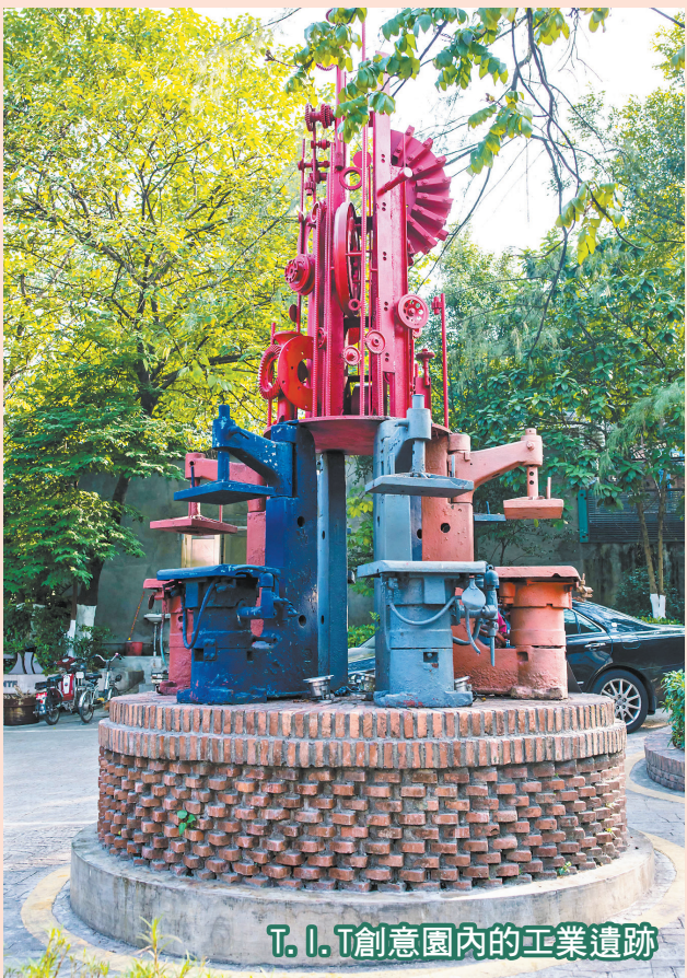
T.I.T創意園內的工業遺跡

2022年12月，廣州市第一批16處工業遺產名單出爐，喚醒了很多街坊的共同回憶，亦勾勒出廣州工業的發展脈絡。 近期，廣州第二批工業遺產完成徵集申報，同樣引人關注。