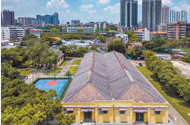
亞細亞龍嘜倉舊址

工業革命後，珠江兩岸先後開辦船舶修造廠、廣州機器局、廣東錢局、繼昌隆織絲廠、泰安大藥房、關東雅印刷局、華興織造總公司等，誕生了大量產業工人，廣州成為中國近現代製造業一個重要發源地，拉開了城市“因商而工、因工而興”的序幕。據《廣州百年大事記》記述，1894年，廣州就有1.03萬產業工人，約佔全國工人總量的14%，廣州工業在全國的地位可見一斑。