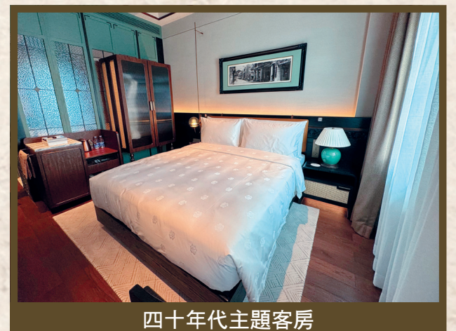
四十年代主題客房

功不可沒，是他不畏投資風險，不顧個人的得失，以天行健君子的風骨，一直秉持“路漫漫其修遠兮，吾將上下而求索”的理念，憑著自強不息，勇於進取的不懈努力，才令一間暮氣沉沉的百年老店煥發出青春朝氣，鑄造成本澳酒店業的一座豐碑。