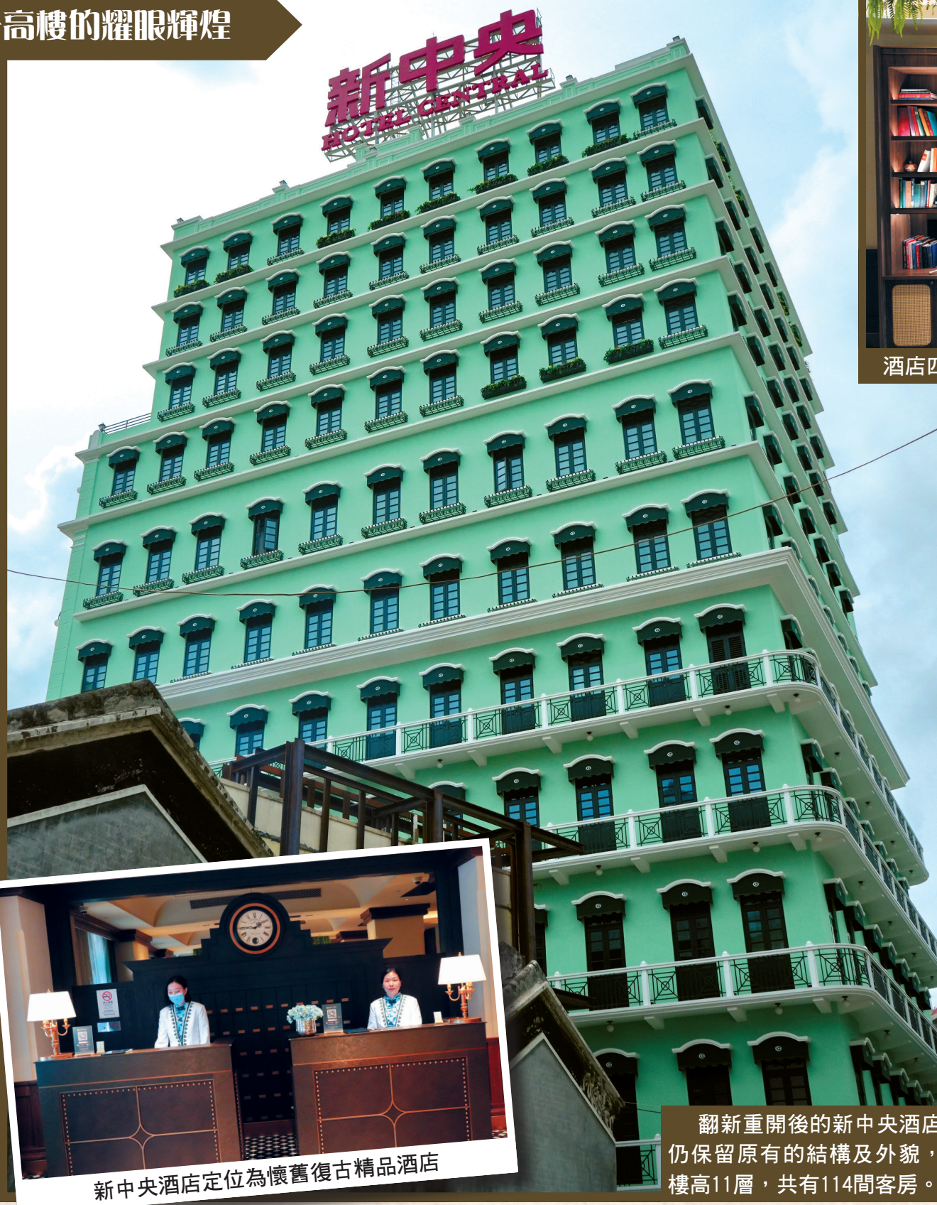
新中央酒店定位為懷舊復古精品酒店

遺憾的是時移世易，隨著澳門社會經濟大環境的變化，以及酒店自身內部原因的影響，新中央的經營每況愈下，最後唯有退出商業江湖的論劍比武，封上圍欄關門結業，黯然失色地蛻伏在坊間一片猜疑與惋惜聲中。