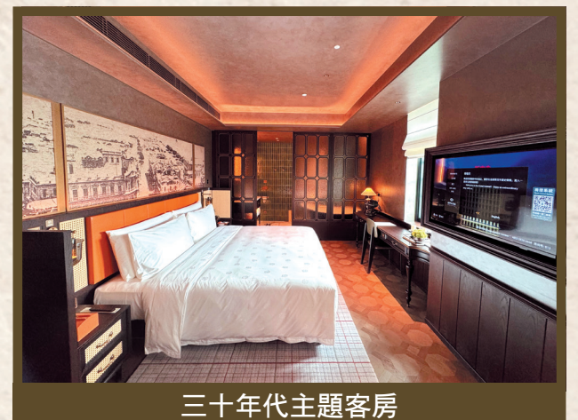
三十年代主題客房