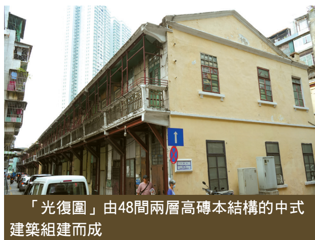
「光復園」由48間兩層高磚木結構的中式建築組建而成

立舊區重整再生的標杆，以美食吸引旅客進入下環舊城區消費並在舊城區留宿，為內港、為下環舊城區注入新活力，為其他投資者起到示範作用，為澳門旅遊產業多元化貢獻力量。