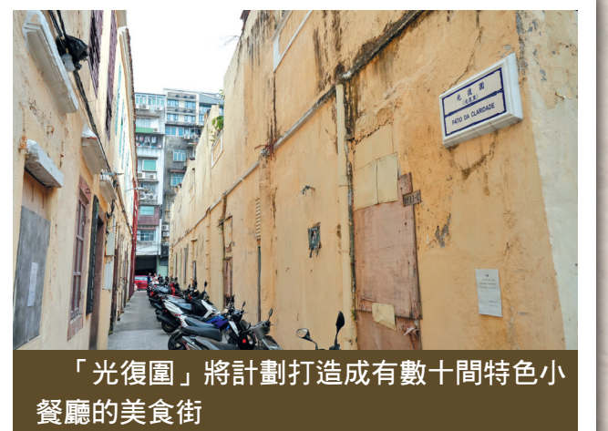
「光復園」將計劃打造成有數十間特色小餐廳的美食街

立舊區重整再生的標杆，以美食吸引旅客進入下環舊城區消費並在舊城區留宿，為內港、為下環舊城區注入新活力，為其他投資者起到示範作用，為澳門旅遊產業多元化貢獻力量。