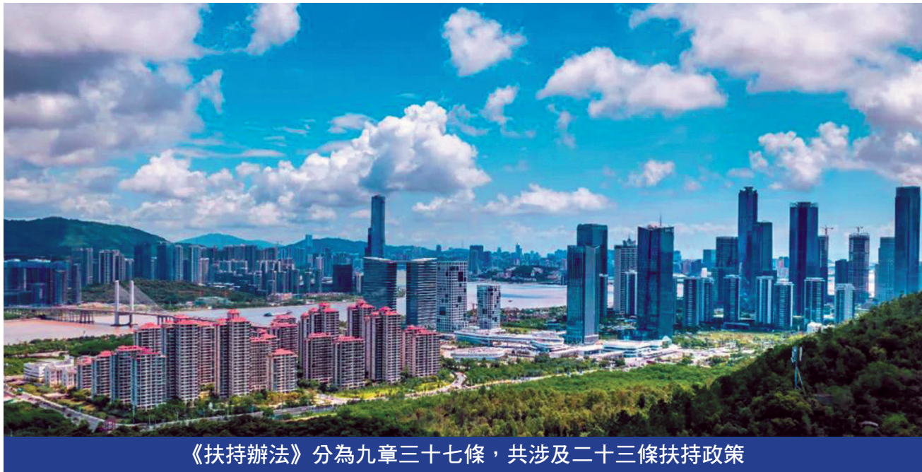
《扶持辦法》分為九章三十七條，共涉及二十三條扶持政策

《扶持辦法》鼓勵企業與澳門及內地各大高校合作，開展電子商務、跨境電商、直播電商產業相關培訓，對符合條件的電商培訓基地給予一次性扶持50萬元。為吸引澳門青年投身電商產業發展，鼓勵基地為澳門青年提供專項培訓，每年最高給予基地150萬元扶持。