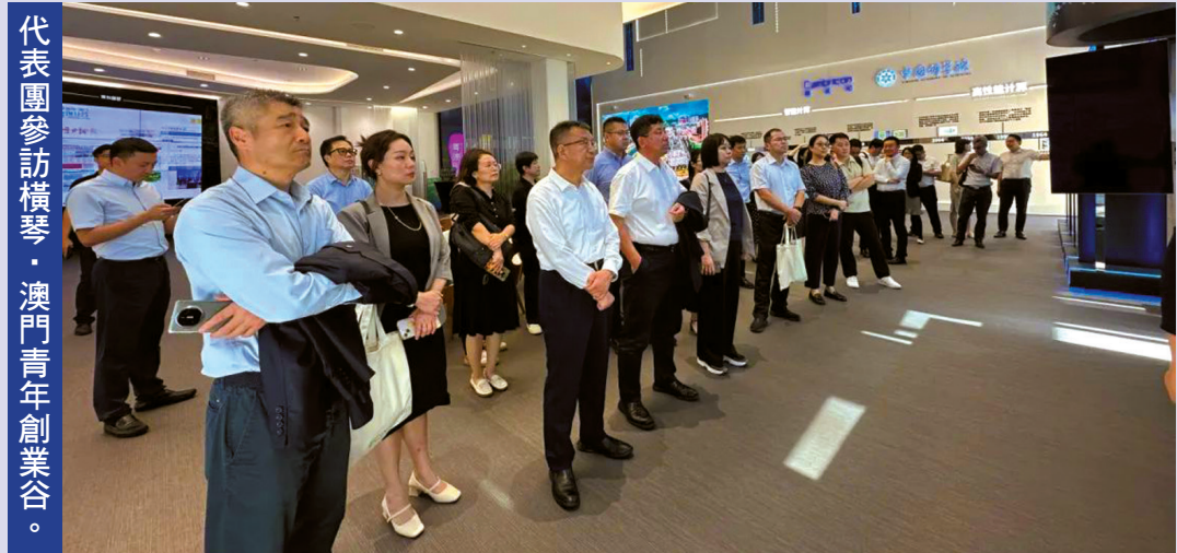
代表團參訪橫琴·澳門青年創業谷。

為進一步加深澳門中資企業對橫琴粵澳深度合作區發展情況的瞭解，促進澳琴商貿合作交流，開拓澳門中資企業在深合區的發展管道，澳門中國企業協會代表團一行逾60位澳門中資企業代表日前赴深合區參訪交流，實地考察橫琴投資營商環境，並參加「多功能自由貿易帳戶政策介紹」講座。