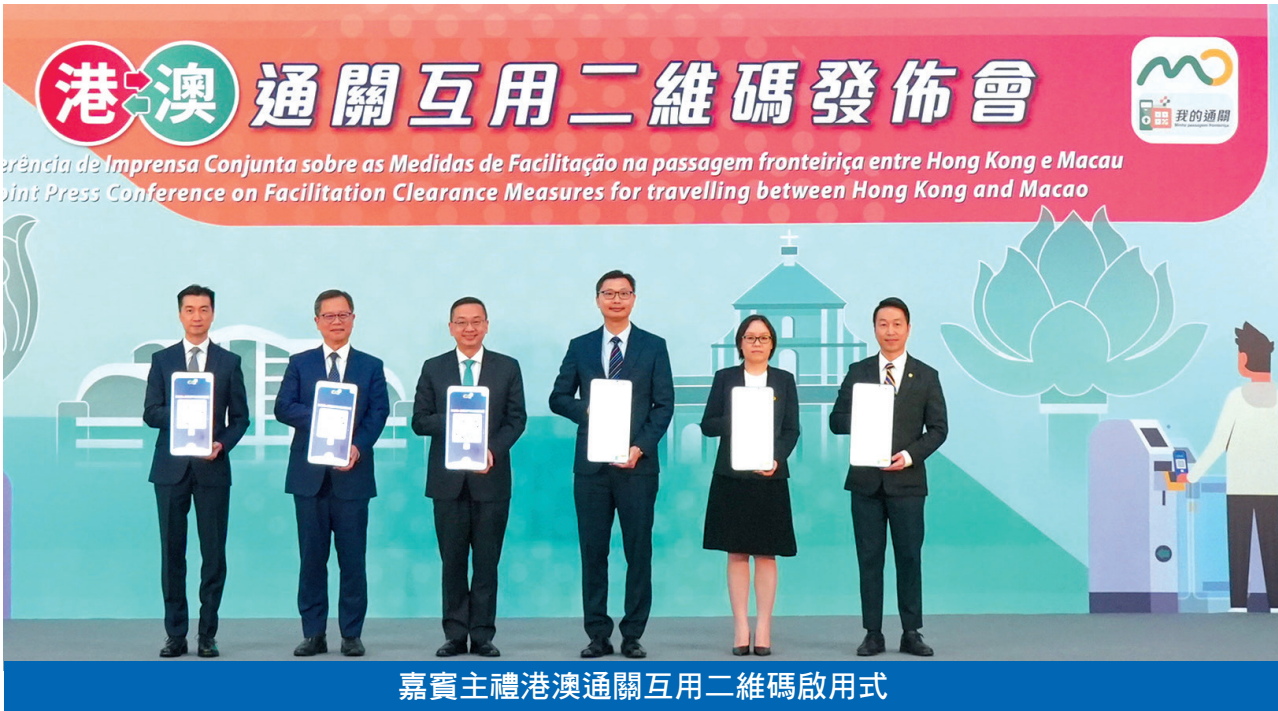
嘉賓主禮港澳通關互用二維碼啟用式

兩地政府昨日於港珠澳大橋澳門邊檢大樓聯合舉行“港澳通關互用二維碼”發佈會，啟動儀式由香港入境事務處處長郭俊峯、澳門身份證明局局長周偉迎、澳門行政公職局局長吳惠嫻、澳門治安警察局局長黃偉鴻、香港入境事務處副處長戴志源及香港入境事務處助理處長柯重鈺擔任主禮嘉賓。