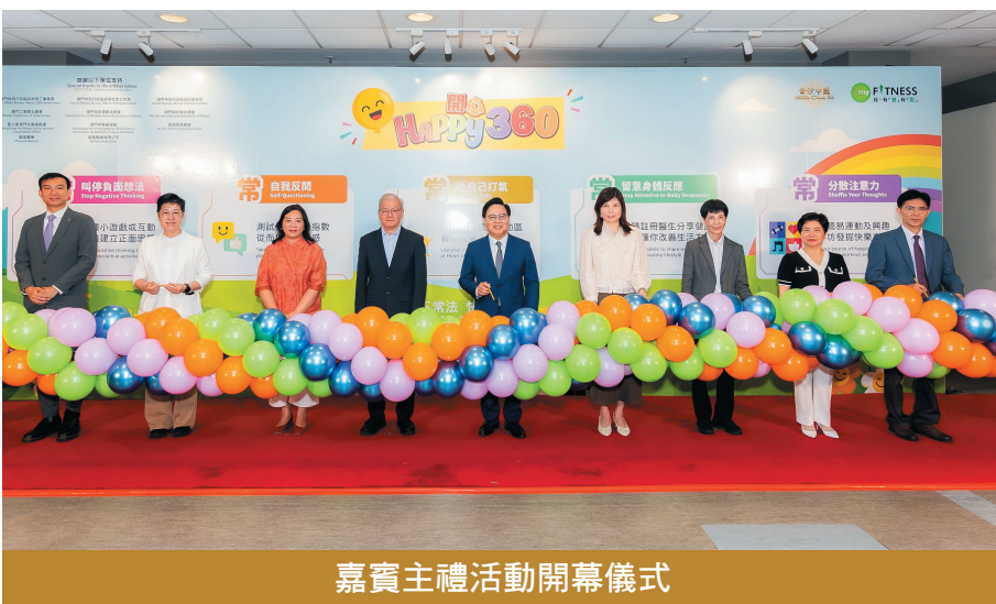
嘉賓主禮活動開幕儀式

活動開幕儀式日前在澳門威尼斯人舉行，澳門勞工事務局局長黃志雄、澳門衛生局疾病預防及控制中心代主任黃穎雯、澳門社會工作局社區協作處處長林佩嫻、澳門工會聯合總會會長何雪卿、澳門街坊會聯合總會會長吳小麗、澳門婦女聯合總會會長劉金玲、聖公會澳門社會服務處服務總監葉鑑波、澳門中醫藥學會會長石崇榮、歐漢琛慈善會會長歐家輝、王英偉出席主禮。