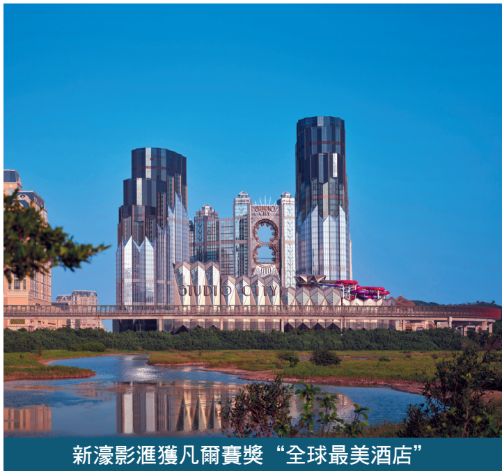
新濠影滙獲凡爾賽獎“全球最美酒店”

【本報訊】新濠博亞娛樂旗下新濠影滙榮獲聯合國教科文組織頒發的建築和設計大獎——凡爾賽獎之「全球最美酒店」，是繼新濠天地後成為公司旗下第二家榮獲凡爾賽獎的綜合度假村。獲得殊榮的澳門新濠影滙W酒店為16家得獎酒店之一，獲凡爾賽獎評選為留下非凡印象的全新落成或重新開幕的酒店項目。