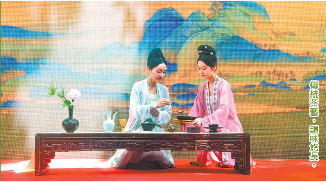
傳統茶藝。韻味悠長。

【轉自廣州日報】世界茶葉看中國，中國茶貿看廣州。廣州茶葉貿易歷史悠久，漢代與今東南亞地區、南亞一帶貿易，唐宋到達紅海沿線，明末進入歐洲。自18世紀廣州“一口通商”開始，全國茶葉僅從廣州出口，十三行建起了世界茶葉貿易體系。海絲之路一度被稱作“茶葉之路”，中國茶與可哥、咖啡一起並稱世界三大無酒精飲料。 歷經千百年積澱，今天，以芳村為據點的廣州依然是中國乃至亞洲最大的茶葉集散地和消費市場，在中國茶行業流通領域具有引領作用，傳承茶貿文化，延續千年商脈。