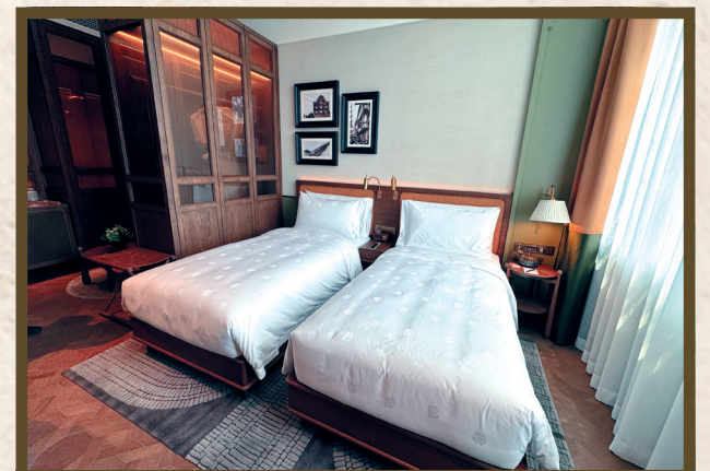
二十年代風格主題客房