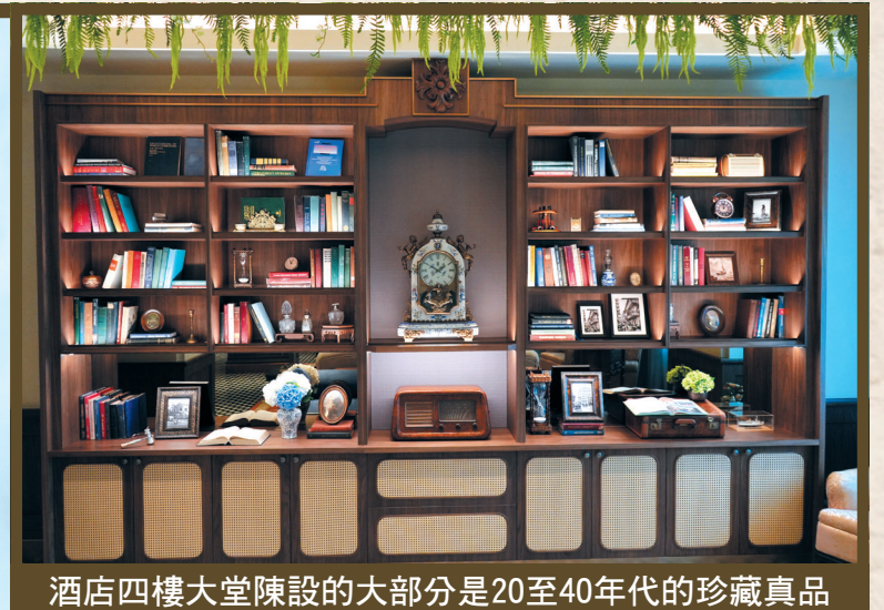
酒店四樓大堂陳設的大部分是20至40年代的珍藏真品