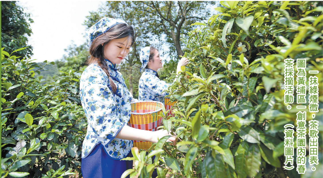
一抹綠煙微，茶歌出田畝。圖為黃埔區二創茶園內的春茶採摘活動。（資料圖片）

【轉自廣州日報】世界茶葉看中國，中國茶葉看廣州。廣州茶葉貿易歷史悠久，漢代與今東南亞地區、南亞一帶貿易，唐宋到達紅海沿線，明末進入歐洲。自18世紀廣州“一口通商”開始，全國茶葉僅從廣州出口，十三行建起了世界茶葉貿易體系。海絲之路一度被稱作“茶葉之路”，中國茶與可哥、咖啡一起並稱世界三大無酒精飲料。 歷經千百年積澱，今天，以芳村為據點的廣州依然是中國乃至亞洲最大的茶葉集散地和消費市場，在中國茶行業流通領域具有引領作用，傳承茶葉文化，延續千年商脈。