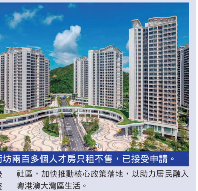
新街坊兩百多個人才房租賃只租不售，已接受申請。

人才房實行“只租不售”政策，租賃對象為符合條件的機構和相關人才，不限戶籍。 都更公司表示，“澳門新街坊”人才房的開放申請，旨在吸引更多高素質人才入住，帶動“澳門新街坊”及整合深合區的人氣、商氣及煙火氣，為在深合區工作、學習、生活的人員打造便利宜居的新家園。 都更公司指，“澳門新街坊”是琴澳兩地共同打造綜合民生項目，是一項跨範疇、跨地域的新嘗試、新探索，團隊將不斷吸