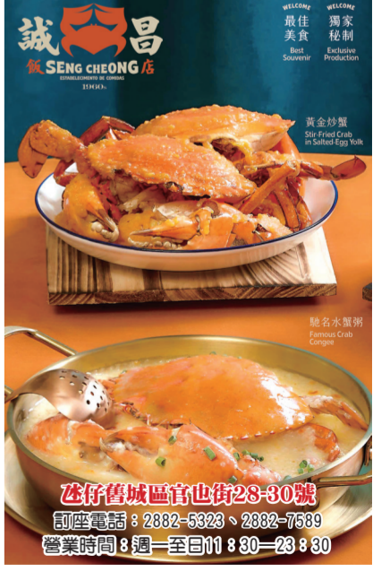
永利舊城區官也街28-30號 訂座電話：2882-5838、2882-7888 營業時間：週一至週日 11:30 - 23:30