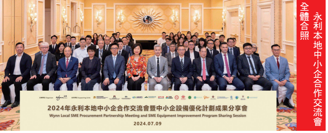
2024年永利本地中小企合作交流會暨中小企設備優化計劃成果分享會 Wynn Local SME Procurement Partnership Meeting and SME Equipment Improvement Program Sharing Session 2024.07.09

賦能中小企擴展業務，創造更多就業機會，為澳門經濟的適度多元化作出貢獻。 去年至今，累計近一千家中小企出席永利舉辦的採購合作洽談會。今年首季，永利對本地中小企採購總額較2023年同期錄得84%升幅，當中對“三類企業”（小微企、澳門製造和青創企業）的採購總額較2023年同期錄得86%增長。有關數據亦反映本地“三類企業”的產品和服務質素，以及個人或企業競爭力都在不斷提升。