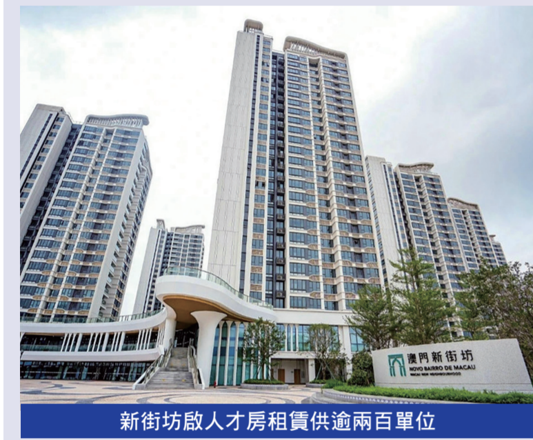
新街坊啟人才房租賃供逾兩百單位