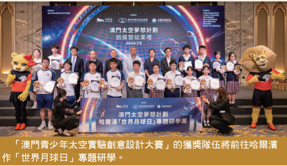
「澳門青少年太空實驗創意設計大賽」的獲獎隊伍將前往哈爾濱作「世界月球日」專題研學。

事活動，激發澳門廣大青少年探索宇宙的興趣和熱情、鑄就他們愛國報國的情懷和本領，並向世界說好澳門故事、中國故事。 「澳門太空夢想計劃」囊括兩大項目，一是為初一至高二年級而設的「澳門青少年太空實驗創意設計大賽」，參賽隊伍在接受國家級航天科學及載荷技術專家提供的全面系統性培訓後，提交太空實驗創意設計作品，並由中國宇航學會專家和澳門本地科技的專業代表進行評選，獲獎隊伍將於暑假前往哈爾濱作「世界月球日」專題研學，而金獎隊伍將獲推薦代表澳門出戰8月在香港舉行的國際賽事「2024國際空間科學與載荷大賽（ISSSP 2024）」。 二是為小學五至六年級而設的「深空來電」航天情境體驗營，參加者於一天的沉浸式體驗營課程中，參與融入航天知識和實踐活動的「劇本遊戲」，並親手製作及發射飛天水火箭、拼裝衛星模型等，優秀學員則有機會參與於11月舉行的珠海航展深度研學團。