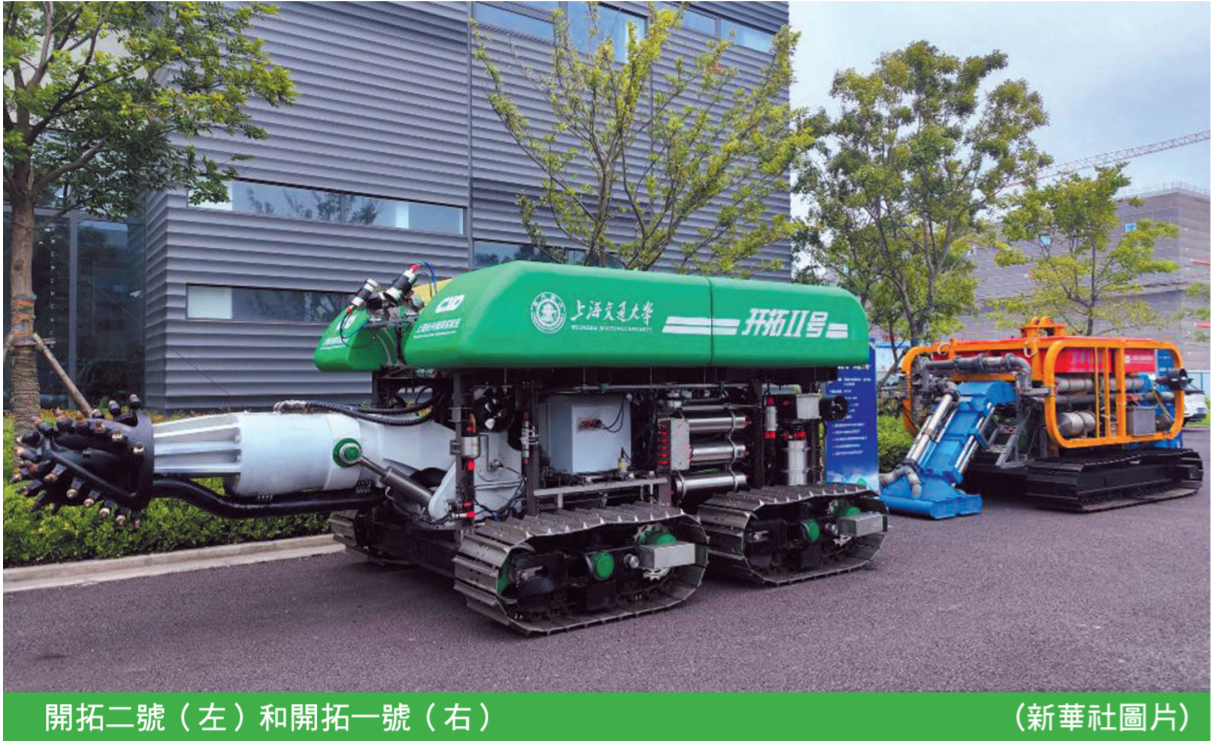
開拓二號（左）和開拓一號（右）

【轉自新華社】在4102.8米海底挖“寶”，成功取回深海多金屬結殼與結核！中國深海礦產資源開發關鍵技術研究與裝備研製取得重大突破。由上海交通大學自主研製的深海重載作業採礦車工程樣機“開拓二號”日前完成海試，首次突破國內深海重載作業採礦車海試水深4000米大關，在國內首創5項新技術。 大洋海底蘊藏著豐富的礦產資源，應用價值極高。但海底地形崎嶇，海況條件複雜，要想在深海探採取“寶”，離不開高端的海底採礦裝備。長6米、寬3米、高2.5米、重14噸。記者在上海長興海洋實驗室看到，“開拓二