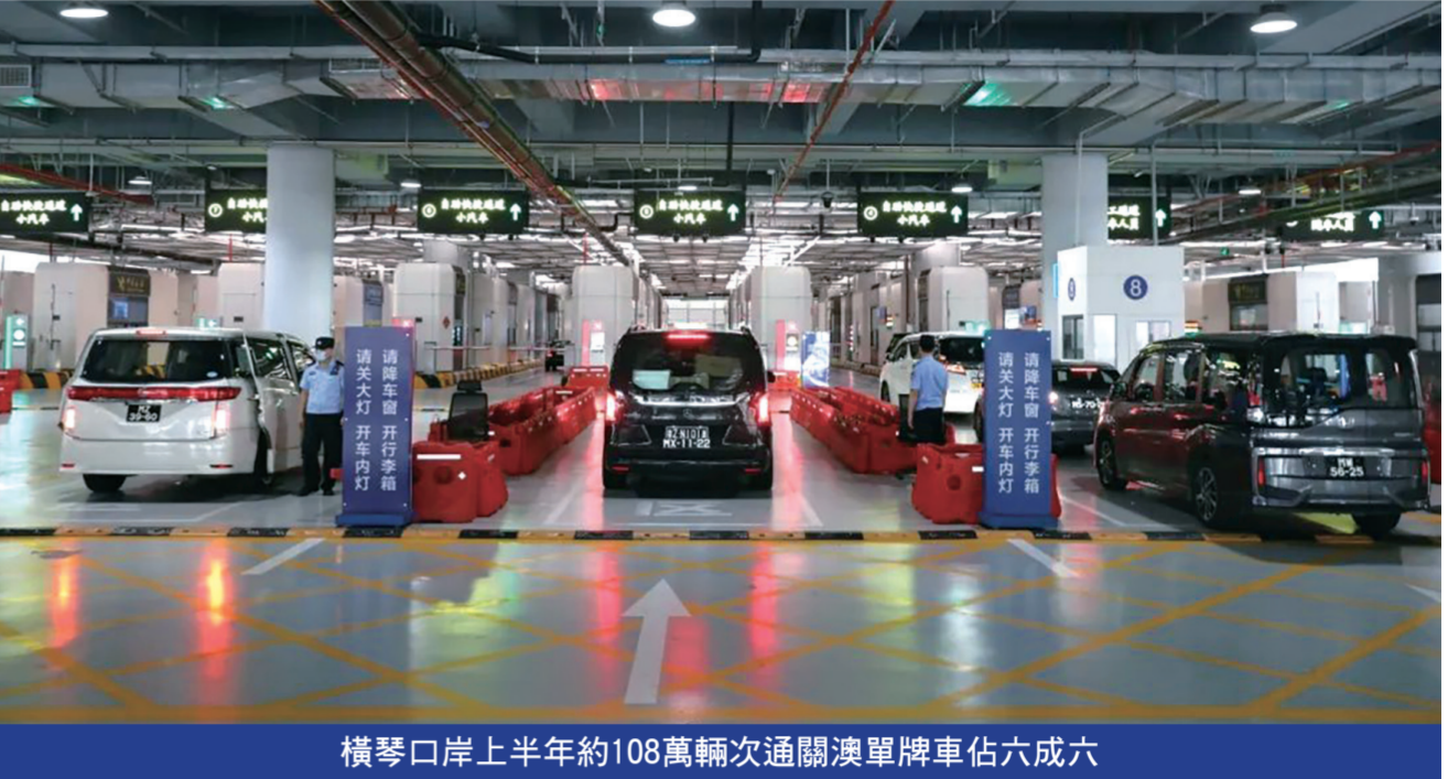
橫琴口岸上半年約108萬輛次通關澳單牌車佔六成六