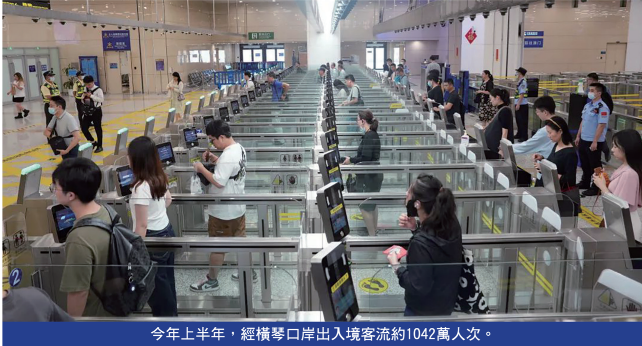
今年上半年，經橫琴口岸出入境客流約1042萬人次。

日，珠海市金海大橋正式通車，大大縮短了珠海市金灣機場與橫琴粵澳深度合作區的往返距離，與此同時，橫琴口岸城軌增設市區線路，橫琴口岸交通樞紐四通八達特點愈加突出。 此外，今年以來橫琴口岸已驗放內地遊客約480萬人次，與去年同比增長77.4%，尤其在春節與“五一”長假期間，橫琴口岸三次刷新單日客流量紀錄，節假日日均客流量穩定在八萬人次。 橫琴邊檢站業務部門負責人表示，面對日益增長的客流量，橫琴邊檢站將持續提升通關服務，積極探索創新高效人員通關模式，為琴澳一體化快速發展貢獻邊檢智慧。