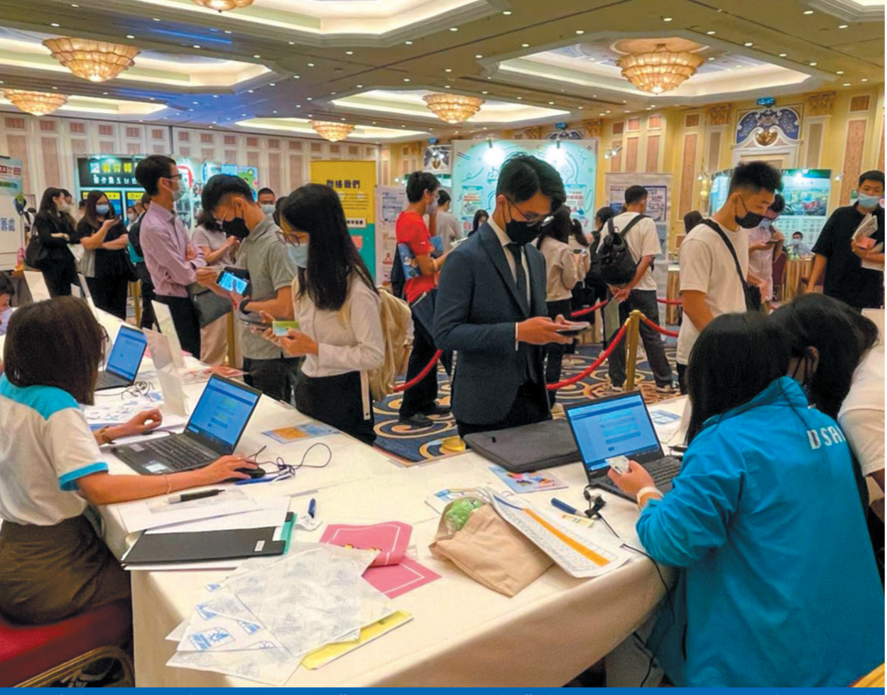
博覽會設有招聘會，超過50間企業提供逾1,500個就業崗位。（資料圖片）

今年博覽會設有招聘會，超過50間企業為澳門青年提供就業配對機會，涵蓋綜合休閒、現代金融、高新技術、公共事業、餐飲、高端零售、社福機構、建築工程等四大重點行業，提供逾1,500個就業崗位。全力支援應屆畢業澳門青年就業和探索就業新動向。 活動期間，邀請了10位與四大產業相關業界代表主講1+4行業講座，向青年講解產業發展新動向，並分享個人職業發展經歷，為青年職涯發展提供建議。又舉辦5場論壇，其中兩場邀請深合區民生事務局領導主管人員、落戶深合區內地龍頭企業的高管人才，與青年對話探索就業新動向，並分享在深合區的發展機遇與相關政策；其餘3場亦邀請了本澳創新企業和公共事業機構的資深人資顧問，為澳門青年介紹企業培養青年人才的相關計劃。另外，又舉辦17場路演，為青年與參展企業和機構之間搭建溝通平台。 適逢第47屆世界技能大賽將於今年9月10日至15日在法國里昂舉行，勞工局9月初將帶領中國澳門代表團參加“第47屆世界技能大賽”19個競賽項目。同時，為響應聯合國大會宣布每年7月15日為世界青年技能日，今年活動期間，邀請了32個單位參展，分別有政府部門、澳門及內地企業、青年社團及機構、學校等組成，劃分成10個展區，當中6個展區提供互動體驗，展示新質生產力推動行業高質量發展的新視界，包括有人工智能應用、虛擬實景技術應用、直播營銷技巧體驗，以及展示第47屆世界技能大賽競賽項目等相關技能，以彰顯通過學習各樣創新技能，為青年提供就業和體面工作的重要戰略。 此外，現場為青年提供多項就業支援及諮詢服務，包括：生涯規劃諮詢、職業培訓、職業安全健康、社會保障相關的勞動權益方面的諮詢服務。