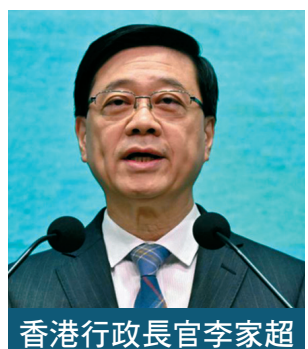
香港行政長官李家超

就大熊貓來港，李家超表示，特區政府已與相關部門展開對接工作，商討大熊貓來港安排，包括檢疫要求、本地設施等。特區政府代表團稍後會前往四川，商討籌備工作，預計大熊貓幾個月後會抵達香港。“市民十分關心大熊貓來港事宜，我也同樣興奮和期待，希望越早越好，但最重要的是