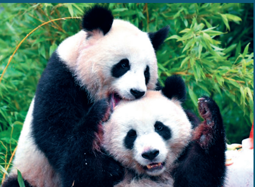
香港將再迎來一對由國家送贈的國寶大熊貓

當天清晨，香港中聯辦、駐港國家安全公署、外交部駐港特派員公署等中央駐港機構也舉行了升國旗儀式。