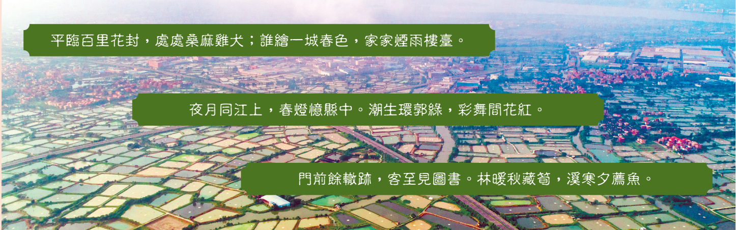
平臨百里花封，處處桑麻難大；誰繪一城春色，家家煙雨樓臺。