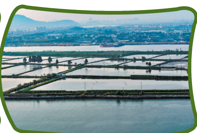
順德桑基魚塘孕育了“求鮮嘗鮮”的美食文化。