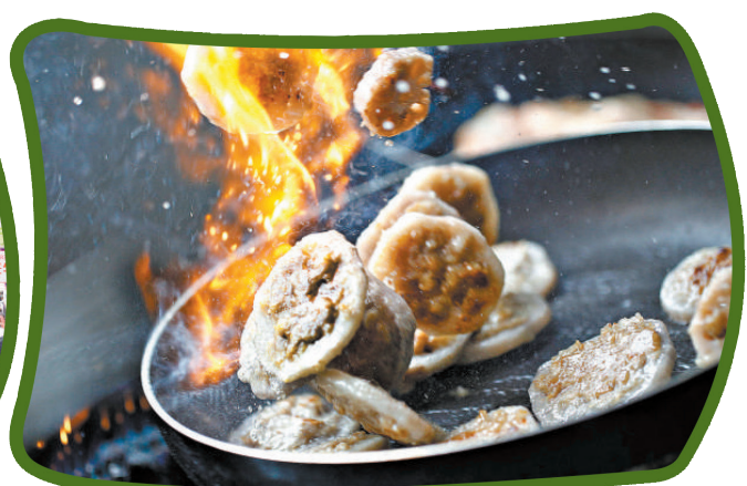
順德廚師擅長“粗料精製”，一道煎釀藕片鑊氣滿滿。

【轉自廣州日報】“食在廣州，廚出鳳城。”廣州是舉世聞名的美食薈萃地，而鳳城（順德）則是廚師之鄉，是粵菜重要發源地之一。