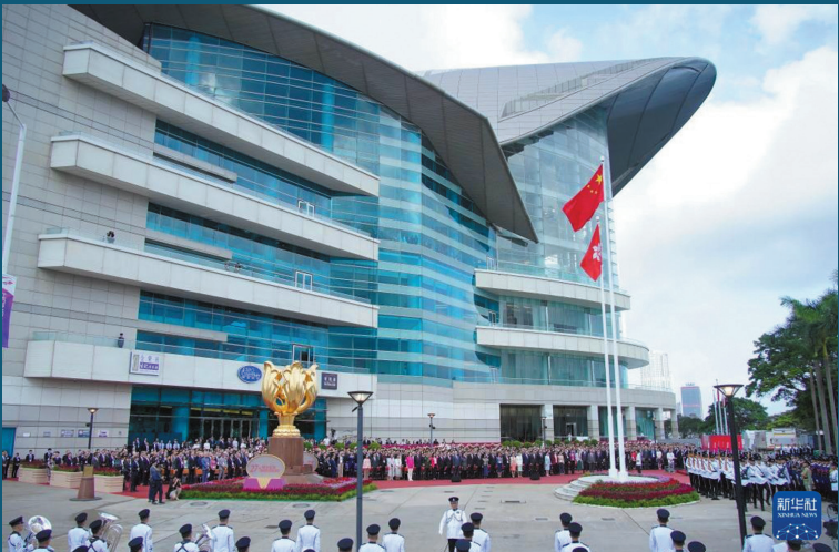
香港舉行升旗儀式和酒會慶祝回歸祖國27周年

【轉自中新網】香港特區行政長官李家超日前出席行政會議前會見媒體時，再度對日前公佈的中央惠港措施表達感謝。他表示，在本屆特區政府即將開展第三年工作之際，中央公佈三個惠港好消息，連同早前公佈的多項惠港措施，都顯示中央對香港的支援和關愛。