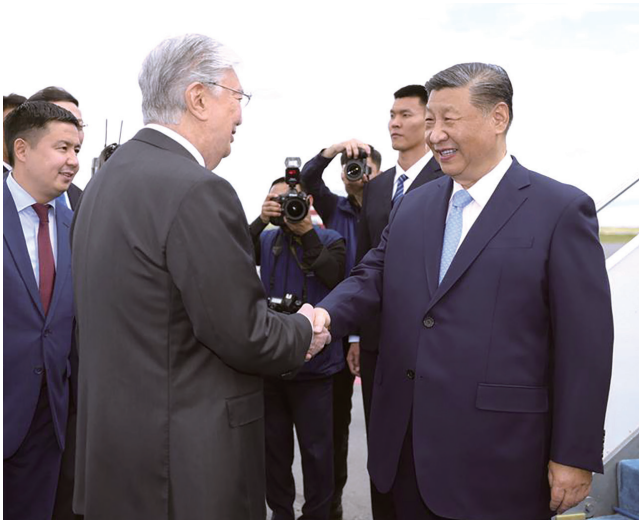
習近平抵達阿斯塔納，哈薩克總統托卡耶夫率政府高級官員熱情迎接。

二是用好互利共贏的合法法寶。中哈資源稟賦各不相同，經濟產業各具特色，互補優勢明顯，合作潛力巨大。中方願加快推進共建“一帶一路”倡議同“公正的哈薩克斯坦”經濟政策深度對接，進一步向哈方開放中國超大規模市場，共用中國發展機遇。我們要深化經貿、產能、投資、能源礦產、農業等傳統領域合作，提升口岸通關效率，推進中歐班列高質量運行和跨海國際運輸走廊建設，完善立體多元高效的互聯互通格局。充分挖掘新能源、數字經濟、人工智能、跨境電商、航空航天等高科技領域合作潛力，