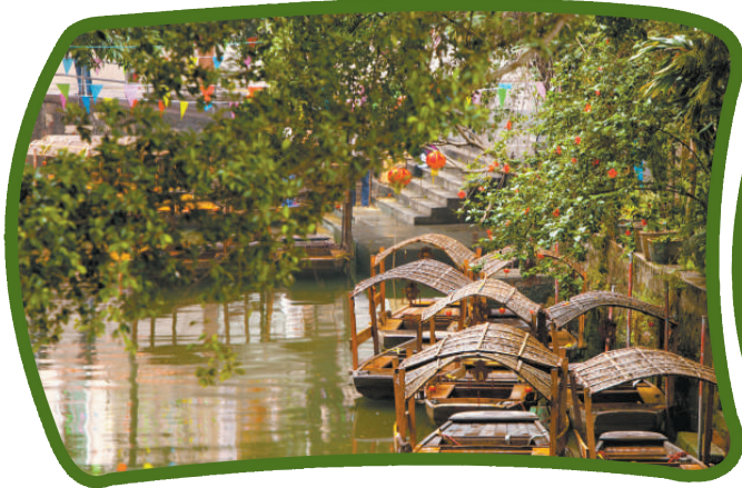
順德逢簡水鄉，風光旖旎。