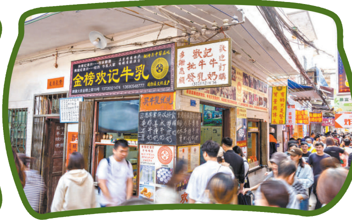
順德老街，美味小吃讓人食指大動。