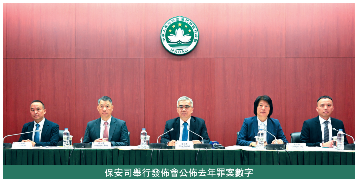
保安司舉行發佈會公佈去年罪案數字

黃少澤又指，去年與博彩相關的專案調查共有1,107宗，較2019年則減少1,050宗，下降48.7%，即大致相當於2019年的半數。為從源頭遏止非法兌換活動，警方持續與內地警務部門合作，對“換錢黨”成員的來源地、資金鏈進行調查，並適時開展聯合行動。去年3月，司法警察局與內地警方共同行動，成功瓦解一個由非法兌換人士組成的跨境詐騙集團，經調查，該團伙涉及2021年至2023年間的54宗騙案，共拘捕61人，涉案金額折合約738萬澳門元。