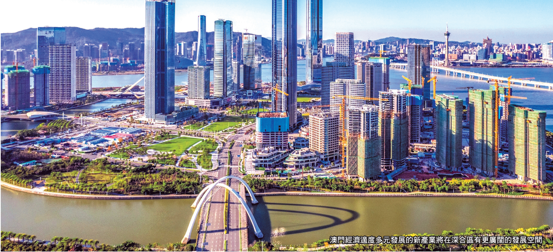
澳門經濟適度多元發展的新產業將在深合區有更廣闊的發展空間

政策的落地實施，仍需要根據深合區不斷發展變化的實際，以及琴澳居民特別是澳門企業、澳門居民、澳門資本等現實需求，不斷優化完善。