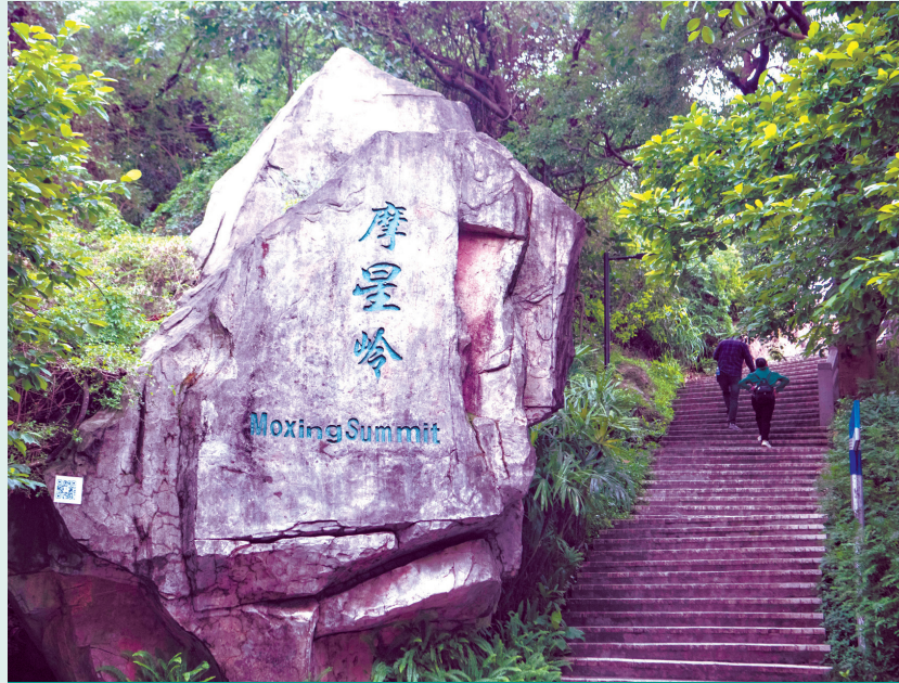
登上摩星嶺，手可摘星辰。

水，滴水岩等即是這樣形成。蒲澗泉的源頭也是懸崖上的泉水下滴而成，這裡的石英岩厚達120米，十分壯觀。而一些地方的紅色風化層被流水沖刷剝蝕，基岩出露，地面風化層下透的地下水也往往在花崗岩的裂隙中流出成泉，成為溪澗之源。九龍泉和白雲山頂一帶的地下水，就是如此而來。表層泉只靠厚兩三米的風化殼來儲水，水量不大，難以成為大量湧泉，所以白雲山中並沒有多少瀑布存在。 根據地質監測，白雲山及廣州城下的地殼正處於相對穩定的時期。（精彩未止 下期再見）