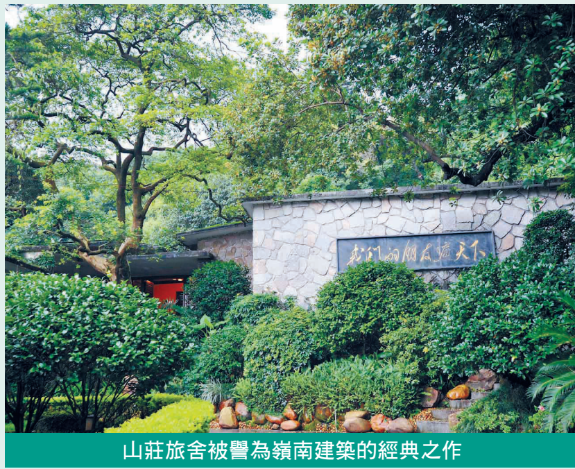
山莊旅舍被譽為嶺南建築的經典之作