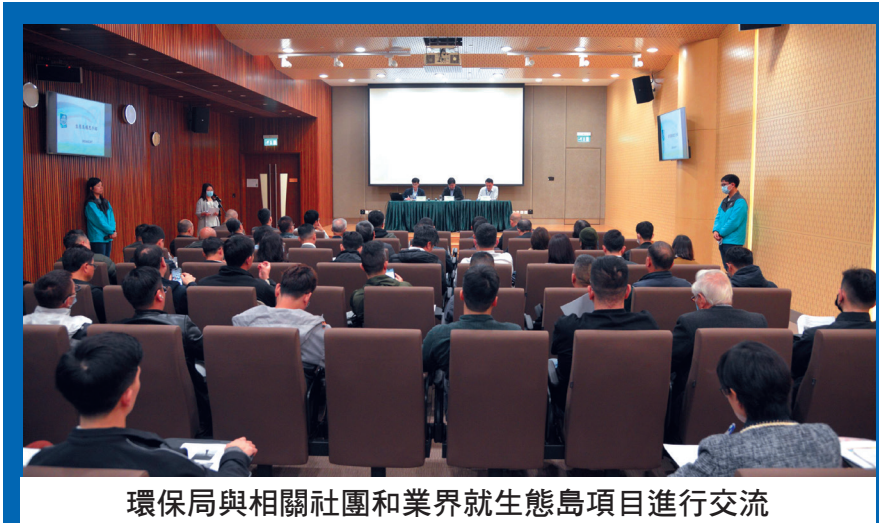
環保局與相關社團和業界就生態島項目進行交流