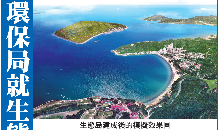
生態島建成後的模擬效果圖

【本報訊】環境保護局於日前舉行兩場面向社團和業界的介紹會，介紹規劃中的生態島項目建造目的和未來發展，並進行討論交流。該局將總結意見，未來也會發佈更多生態島項目資訊，實事求是推進項目。