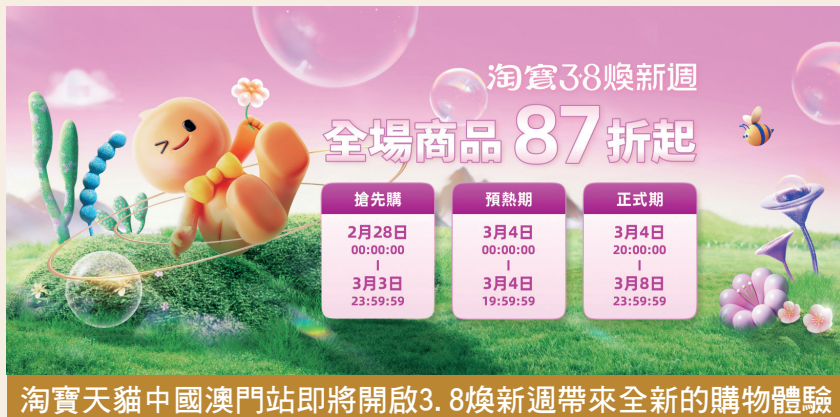
淘寶天貓中國澳門站即將開啟3.8煥新週帶來全新的購物體驗

87折的官方立減優惠。正式期：3月4日20:00至3月8日23:59，能享受到官方立減、淘寶天貓跨店滿減、菜鳥直運券，以及由銀行及等支付機構提供的多重優惠。