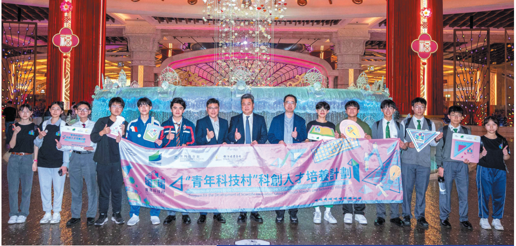
銀娛早前為「青年科技村」學員組織3場研學參訪活動

有參與研學參訪活動的學員表示:「感謝銀娛的悉心安排,讓其能夠在課室以外,實地考察及認識大型綜合度假城的科技應用,深刻體會科技創新對推動不同行業發展的重要性,活動中的科技多元互動體驗,不但提升對學習科技的興趣,更有助拓展及完善知識儲備,獲益良多。」