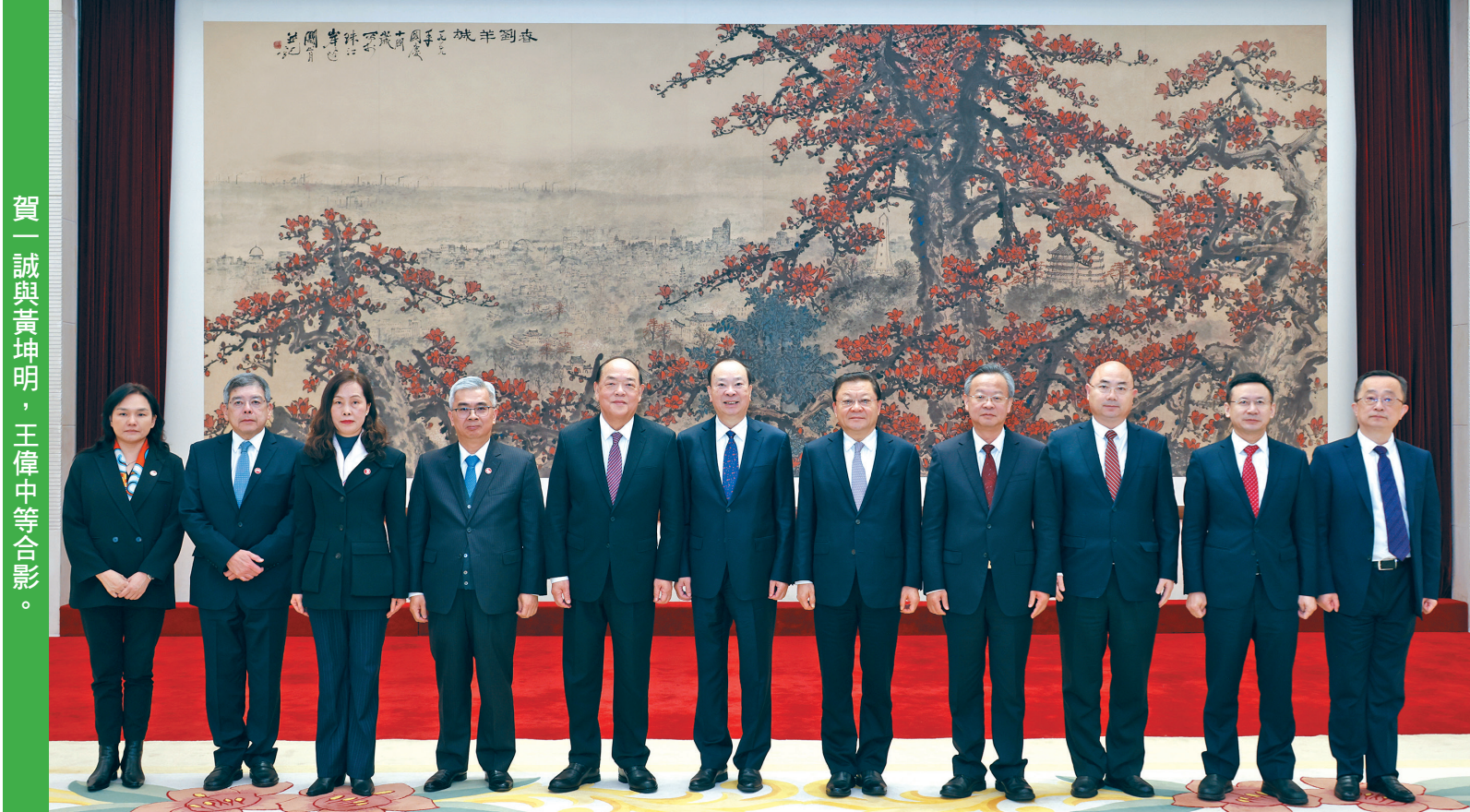
賀一誠與黃坤明，王偉中等合影。

廣東省委常委、宣傳部部長陳建文，省委常委、統戰部部長王瑞軍，副省長張新；保安司司長黃少澤、社會文化司司長歐陽瑜、運輸工務司司長羅立文及行政長官辦公室主任許麗芳等參與了會面。