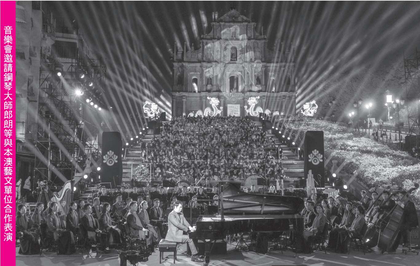
音樂會邀請鋼琴大師郎朗等與本澳藝文單位合作表演

旅部精心組織的龍年“歡樂春節”系列活動意義深遠，系列活動在澳門舉行啟動儀式，體現中央對澳門獨特文化地位的重視，凸顯澳門在國家對外文化傳播交流中重要作用，特區政府對此表示衷心感謝。