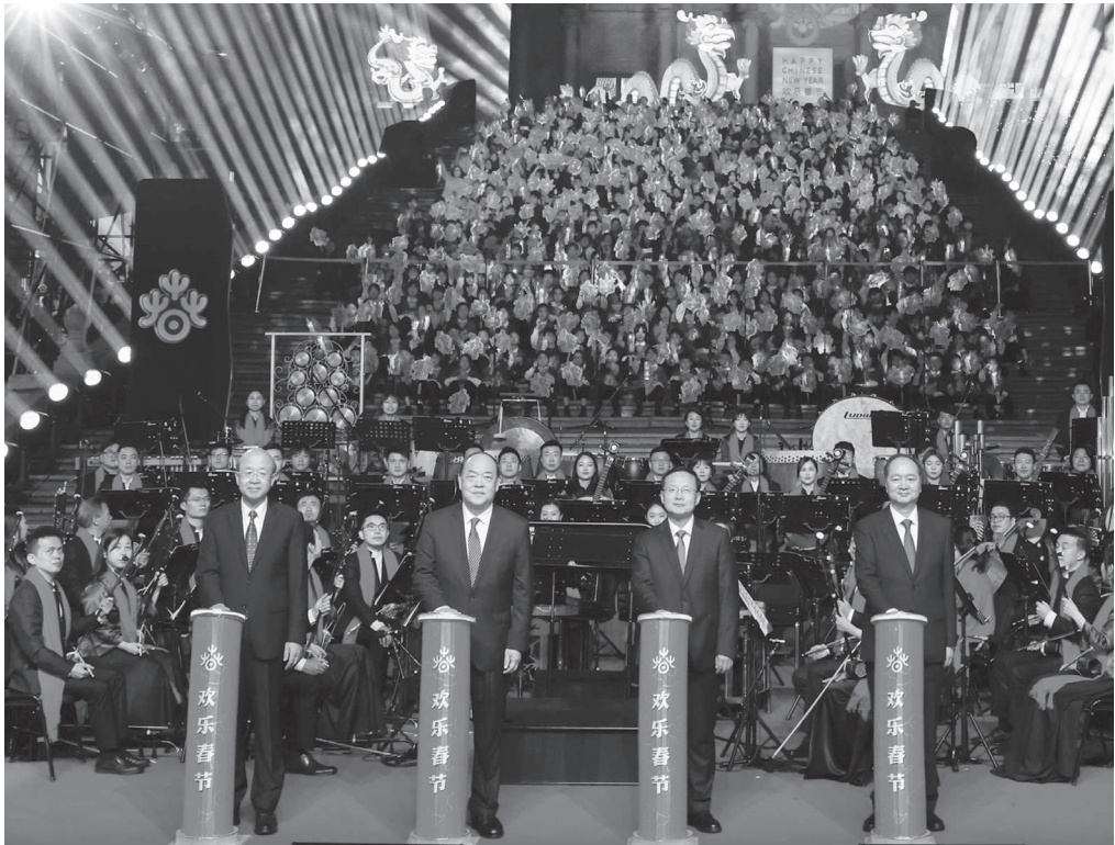
嘉賓主禮“歡樂春節”啟動儀式

賀一誠致詞表示，春節是中華民族最重要的傳統節日，延綿了悠久的中華文明之脈，凝聚了濃郁的炎黃子孫之情，積澱了厚重的傳統文化之美。今年是中華人民共和國成立七十五周年，也是澳門回歸祖國二十五周年。在這一重要時間節點，文