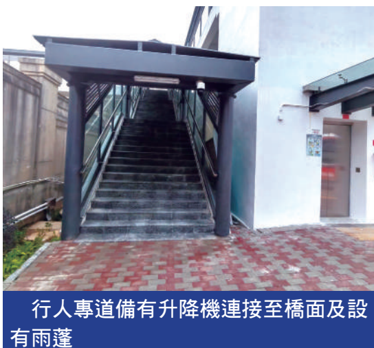
行人專道備有升降機連接至橋面及設有雨蓬

澳門大學連接橫琴口岸通道橋設雙向單線行車，全長約808米，行車道已於早前通車，備有升降機連接至橋面及設有雨蓬的行人專道亦已開通，為市民及遊客往來澳門大學至橫琴口岸提供更便捷的通道。