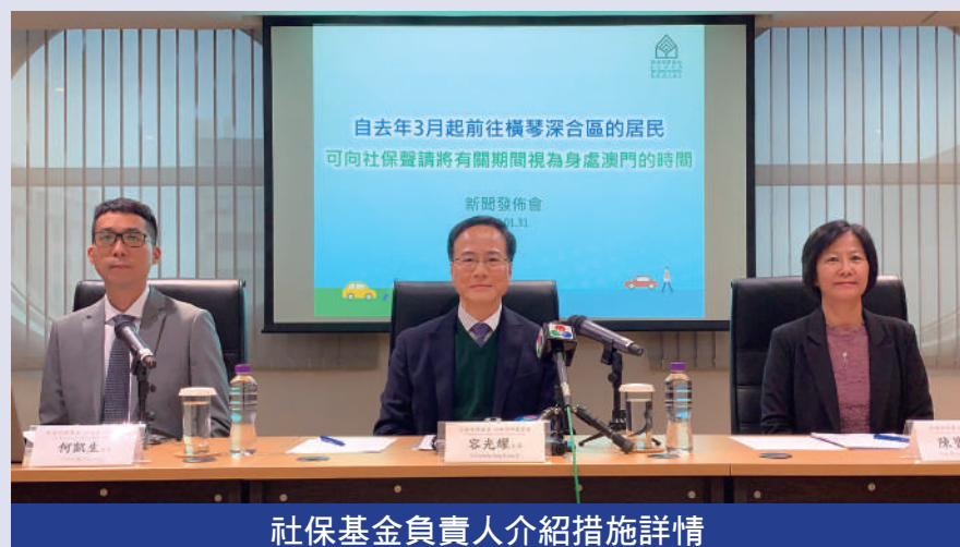
社保基金負責人介紹措施詳情

容光耀表示，隨着廣東省第十三屆人民代表大會常務委員會第四十八次會議通過《橫琴粵澳深度合作區發展促進條例》，並自去年三月一日起實施，加上特區政府亦陸續公佈有利政策等，相信越來越多澳門居民會到深合區發展。為保障部分未能符合法律所指明確原因、且原本常居澳門的居民，其雙層式社會保障制度的權益不因前往深合區發展而受影響，自“條例”實施日起，因前往深合區學習、就業、創業、生活等情況，可納入為“人道或其他適當說明理由”例外情況中不在澳的適管理理由。當居民有需要申請任意性制度登錄或主張有權列入非強制中央積金政府撥款名單時，可以“適當說明的理由”向社保基金提出申請，符合條件的澳門居民，經審核批准，其在橫琴深合區的期間可視為身處澳門的時間。