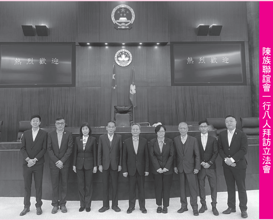
陳族聯誼會一行八人拜訪立法會

年遵紀守法、培養他們的家國情懷十分重要。南雄珠璣巷陳氏宗祠的祖訓家規就開宗明義地寫道：崇道德、尚禮儀；忠孝傳家，詩書繼世。講的其實就是家國情懷，日後的會務應循從這一宗旨進行。 高開賢非常認同陳族聯誼會的辦會方向和理念，澳門回歸祖國後，社會民生發生了翻天覆地的變化，希望大家不要忘記過去，讓年青一代增強國家的認同感和歸屬感，自覺維護澳門基本法，確保“一國兩制”行穩致遠，澳門長治久安。 拜訪後，高開賢帶領拜訪成員參加立法會，並合照留念。