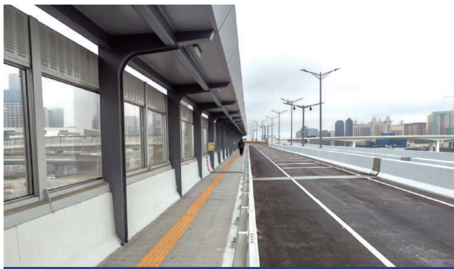
行人往來澳門大學至橫琴口岸將更加便捷

澳門大學連接橫琴口岸通道橋位於蓮花大橋南側，通道橋之行人專道日前已正式開通，行人往來澳門大學至橫琴口岸將更加便捷。