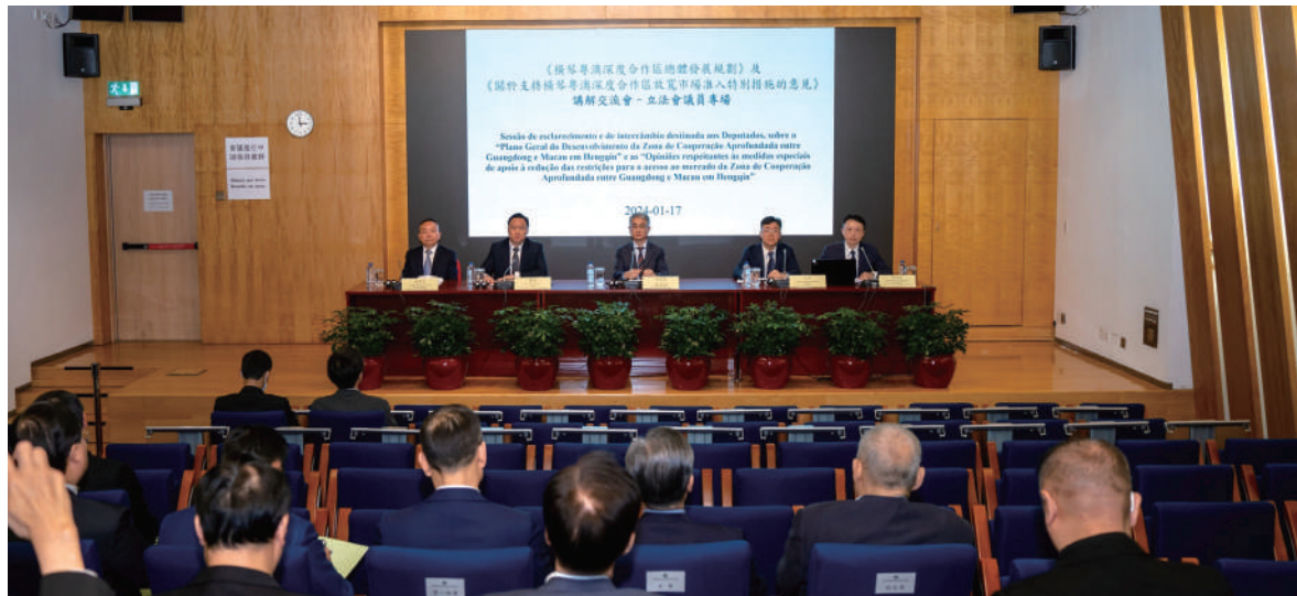
張永春司長等向立法會介紹深合區放寬市場准入特別措施