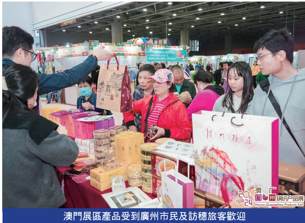
澳門展區產品受到廣州市民及訪穗旅客歡迎