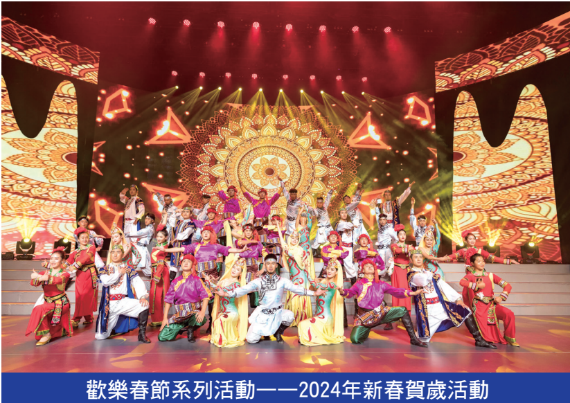
歡樂春節系列活動——2024年新春賀歲活動