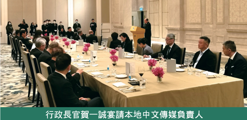
行政長官賀一誠宴請本地中文傳媒負責人

甦，聚力多元，優化民生，提升發展”的施政總體方向，敢於擔當、善於作為，以穩求進、以進促穩，於變局中開新局，以更大作為，堅定維護國家安全社會穩定，主動加強布局，扎實築牢國安屏障，加快落實“1+4”規劃確定的各項主要任務和重點項目，加速推進深合區建設，切實推動澳門經濟高質量發展。持續改善民生，促進和諧，不斷提升管治水平和能力，着力破解經濟社會發展中的深層次矛盾和問題。充分發揮澳門自身優勢，更好融入國家發展大局，推動特區各項事業實現新的發展。 他指出，2024年是新中國成立75周年，也是澳門回歸祖國25周年、深合區實現第一階段發展目標之年，更是落實《澳門特別行政區經濟適度多元發展規