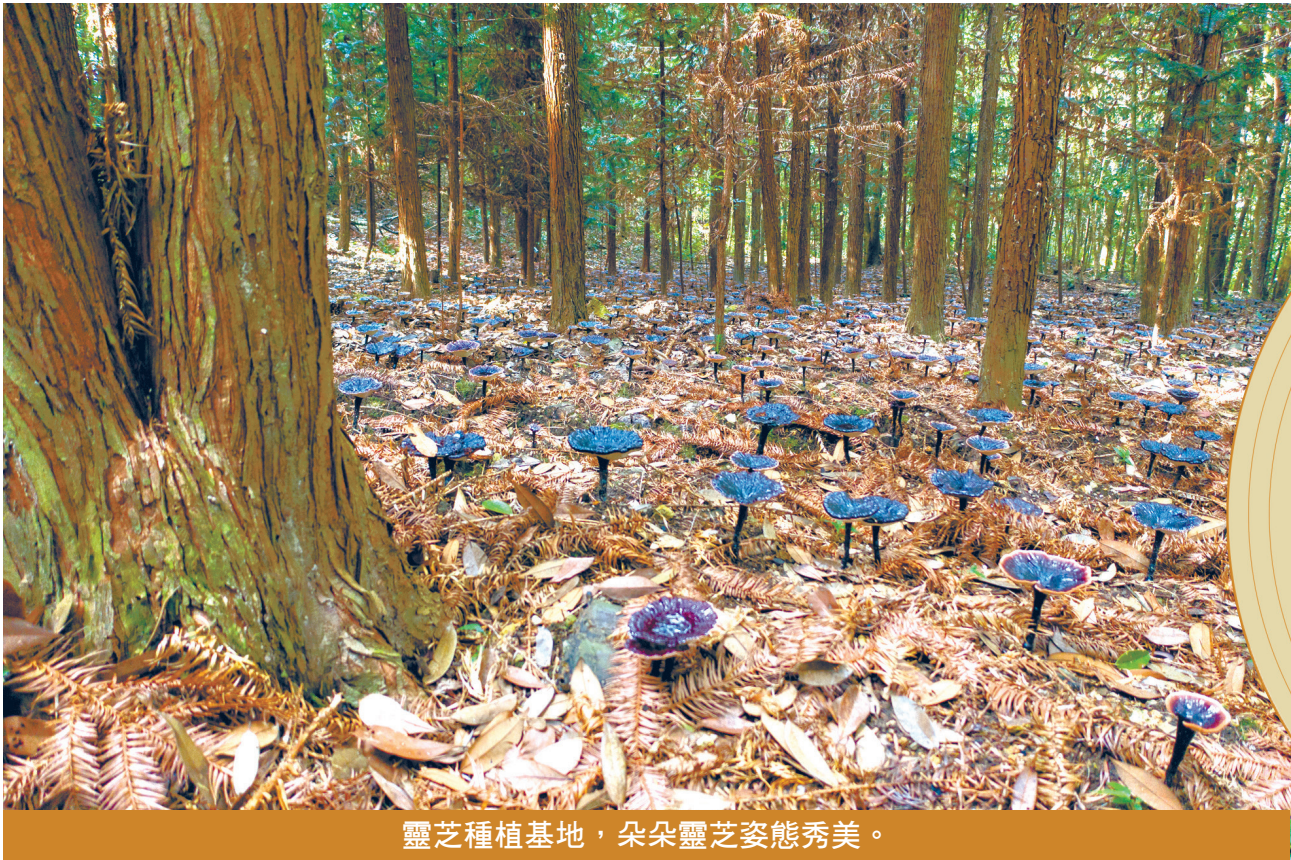
靈芝種植基地，朵朵靈芝姿態秀美。

從晉至初唐，廣州人對中藥的認識和應用還局限於中原醫藥原有體系，集中於本地藥材。自大唐盛世後，廣州崛起為世界性港口，1.4萬公里的“廣州通海夷道”從廣州出發，經南海直抵西亞。中國進口的商品，除寶石、犀角、珍珠外，還有一大類是香藥，其中蘇合香、乳香、沉香等尤為突出。因此，唐宋時期的海上絲綢之路又稱“香藥之路”。 當時，廣州的香藥貿易有多興盛？唐天寶八年（749年），鑒真和尚東渡日本回國途經廣州時，曾記下他親眼看見的情景：“江中有婆羅、婆斯昆侖等舶，不計其數，並載香藥、珍寶，積載如山。”唐穆宗時，波斯大商人李蘇沙販運到中國的海外珍貴藥材沉香，多得可以造一座亭子。 宋代，朝廷還設專員經水路將從廣州進口的香料運到京城。北宋神宗熙寧十年（1077年），全國有3個口岸向外商收購乳香，廣州一處就購得34.87萬斤，佔全國乳香總進口量的98%。 大量藥材貿易不僅為廣州帶來巨額經濟財富，更讓廣州人較早地接觸到外國醫藥，大大地豐富了廣州醫藥文化底蘊，為明清時期一批名廠名藥的誕生和崛起積澱了肥沃的土壤。 （精彩未止 下期再見）