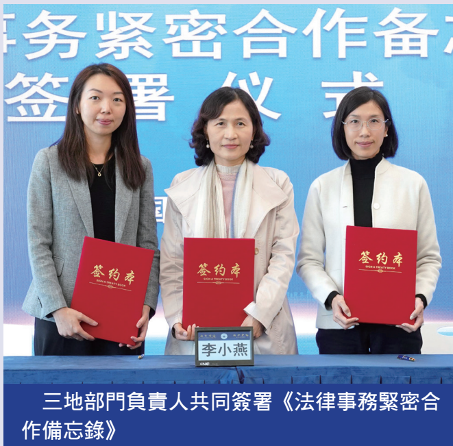
三地部門負責人共同簽署《法律事務緊密合作備忘錄》

澳門法務局局長梁穎妍、珠海市司法局局長李小燕和橫琴粵澳深度合作區法務局局長鍾顯儀日前在橫琴共同簽署《澳門特別行政區政府法務局珠海市司法局 橫琴粵澳深度合作區法律事務局法律事務緊密合作備忘錄》。