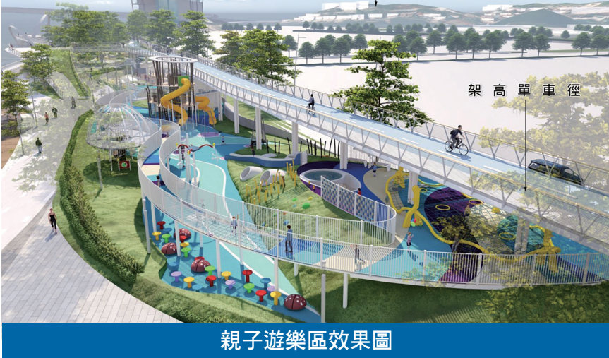
親子遊樂區效果圖

多功能廣場位於整個區域的主入口位置，設有親水表演舞台、旱噴泉廣場及景觀棧道，廣場空間可舉辦活動及支援美食節舉行，於農曆新年的特定日子亦可劃為爆竹煙花燃放區用途。廣場旁之綜合滑板場配合功能需求，利用了山丘起伏的設計，同時單車租借室及公廁等設施等亦可隱藏在地形下；另外，亦設有五人足球場、籃球場及練習場的球場區；康體區則有大眾健身區、平衡障礙區、長者及傷健共融區等，供不同需要的人士舒展身心。 利用休憩區沿海特點，設置不同的觀水空間，包括中央廣場及眺望台，上層平台可連接單車橋；下層為多用途空間／商業空間及戶外親水平台。區域東端設置餐飲空間及眺望平台，此外於合適沿岸位置設釣魚區。讓市民與海岸更接近，增加市民休閒的親水空間並飽覽澳門優美的海岸景色。 區內將設有輕食餐飲空間、小賣亭及自動販賣機、戶外用餐桌椅以及公廁等配套設施，分佈於區內