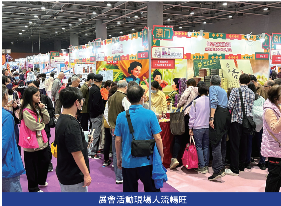
展會活動現場人流暢旺