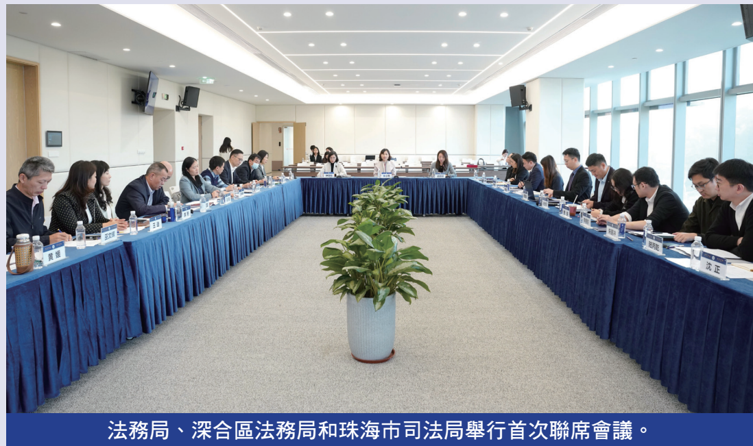
法務局、深合區法務局和珠海市司法局舉行首次聯席會議。