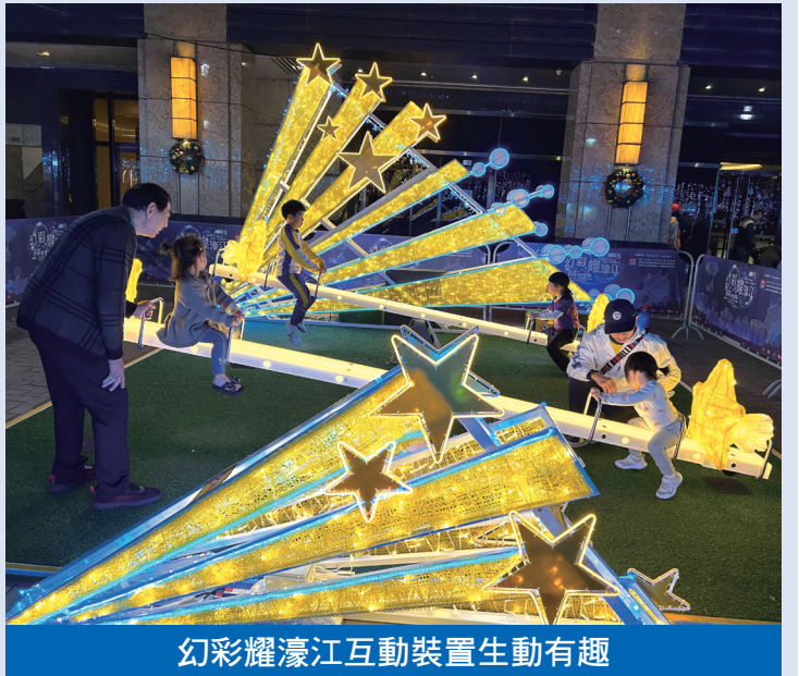
幻彩耀濠江互動裝置生動有趣

源，每步都是色彩的釋放，擁有令人開懷歡笑的魔法。踩上壓力感應器，就會產生音效與顏色的變化。 新口岸填海區-宋玉生廣場的“發光不倒翁”：不倒翁蘊含著關於力和平衡的科學道理，有趣味及科普性，激發孩子的奇思妙想。北區-飛喇士街休憩區的“樂園收藏卡”：可能是世界上唯一以光線織造的樂園收藏卡，掃描卡上的QR Code即可與可愛AR“閃星”同行。氹仔區-嘉模墟的“奇幻遊樂屋”：踏上“奇幻遊樂屋”內的光影飛行棋，期待飛往更遠的地方。靠近新月燈光裝置，感應器會觸發“雨燈”移動。 其他多元互動裝置尚有：下環區的“願望之環”；南灣區的“花海奇緣”、“美蝶許願球”和“步步飛花”；新口岸填海區的“如影隨行”、“時光鞦韆”、“浮光掠影”和“心心相印”；北區的“流星蹺蹺板”、“幻彩傳情”和