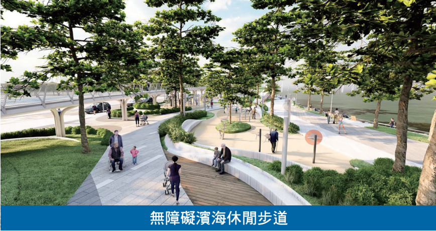
無障礙濱海休閒步道

南岸海濱綠廊第二期整體設計概念遵從《澳門特別行政區城市總體規劃（2020-2040）》在景觀方面的指引性原則，佈局劃分不同功能分區，以無障礙海濱休閒步道及單車徑貫穿全區主要動線，海濱休閒步道闊至少五米，單車徑長約一千三百米，來回線各寬四米，一圈總長約二千六百米。為最大化使用休憩區用地，單車徑部分以架高設計，同時可提供更多遮陽空間。 整個片區將透過山丘起伏的微地形設計，在增加綠化及遮蔭同