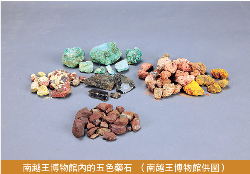
南越王博物館內的五色藥石

魏晉南北朝時期，中原地區戰亂不斷，大量人口南遷，促進廣州中醫藥文化繁榮發展，並出現醫學專著。其中，影響力最大的當屬葛洪。葛洪何許人也？他是晉代著名醫學家，光熙元年（306年）曾到廣州，結識了癡迷煉丹術的南海郡太守鮑靚。鮑靚將自己的女兒鮑姑許配給他，葛洪夫妻就在廣州行醫救人。鮑姑醫術精湛，尤其擅長用