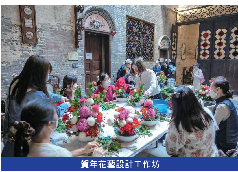
賀年花藝設計工作坊