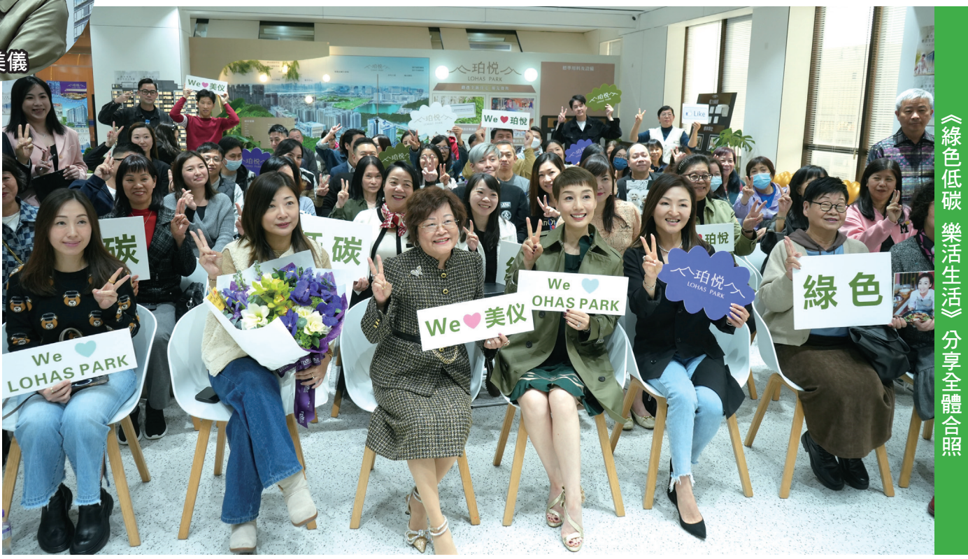
《綠色低碳 樂活生活》分享全體合照