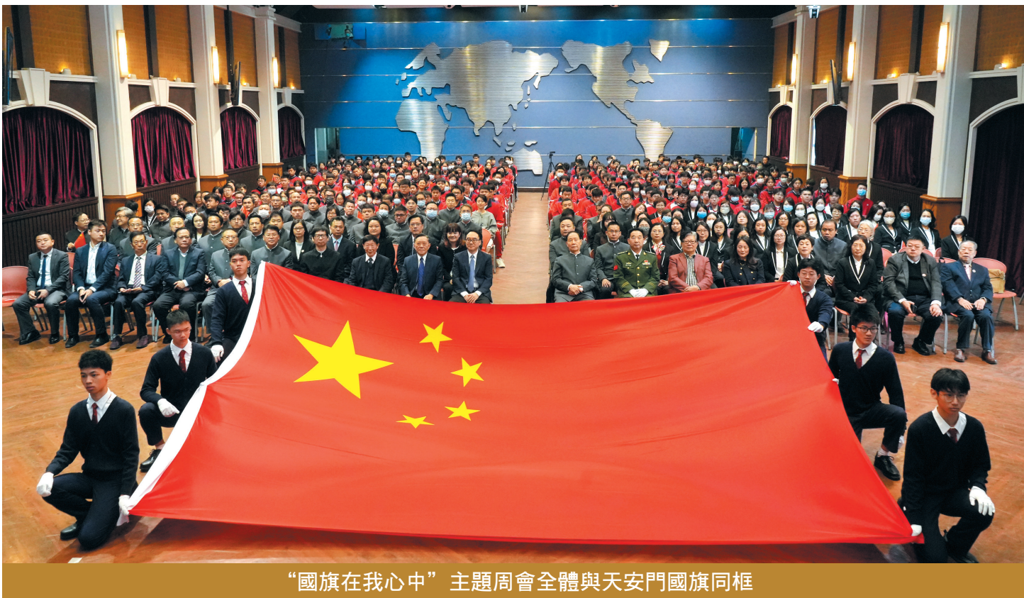
“國旗在我心中”主題周會全體與天安門國旗同框

愛國是每個人的責任 北京天安門國旗班首任班長、北京武警部隊支隊長、《國旗法》國旗知識神州行活動組委會主任董立敢，昨日在濠江中學作《國旗在我心中》主題報告，講述國旗知識和國旗故事。他表示，“中華人民共和國國旗是五星紅旗，是中華人民共和國的象徵和標誌，每一個公民和組織都應當自覺的尊重和愛護國旗。愛國主義教育是主旋律，現在，國旗教育也深入開展，學校堅持舉行升國旗儀式，營造了良好的愛國主義氛圍。 董立敢在講座介紹國旗的誕生歷史，1949年9月27日，中國人民政治協商會議第一屆全體會議經過舉手表決，確定中華人民共和國國旗為五星紅旗，並公佈了《國旗制法說明》及使用規定。這一天便是五星紅旗的誕生之日。國旗的左上方綴有五顆五角星，其中最大的那顆尖角指向正上方，象徵中國共產黨；右邊四顆小五角星，各有一個尖角指向大五角星的正中央，象徵全體中國人民團結在黨的周圍。紅色的底色象徵著無數革命先輩的鮮血；黃色代表中華民族的膚色，寓意在紅色大地上綻放光明。 他指出，每一個公民、組織都有義務掌握國旗的圖樣，更應該自覺尊重、愛護國旗。平時發現錯誤使用國旗、不尊重國旗的行為，都要主動制止。不以事小而不為，細微之處見精神。愛國不是一句空洞的口號，愛國要從實際做起。