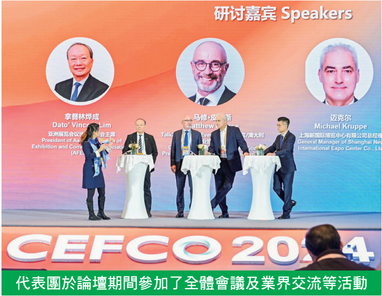
代表團於論壇期間參加了全體會議及業界交流等活動

另外，有澳門會展業界代表團成員認為透過參會可促進本澳與海內外會展業界之間的交流和合作，亦能加深了解全球各地會展業的實用資訊，為澳門會展業界發展提供新思路及啟發；同時，有助推動澳門會展業與國際接軌，吸引更多會展活動落戶澳門。