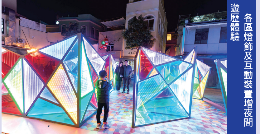
各區燈飾及互動裝置增夜間遊歷體驗