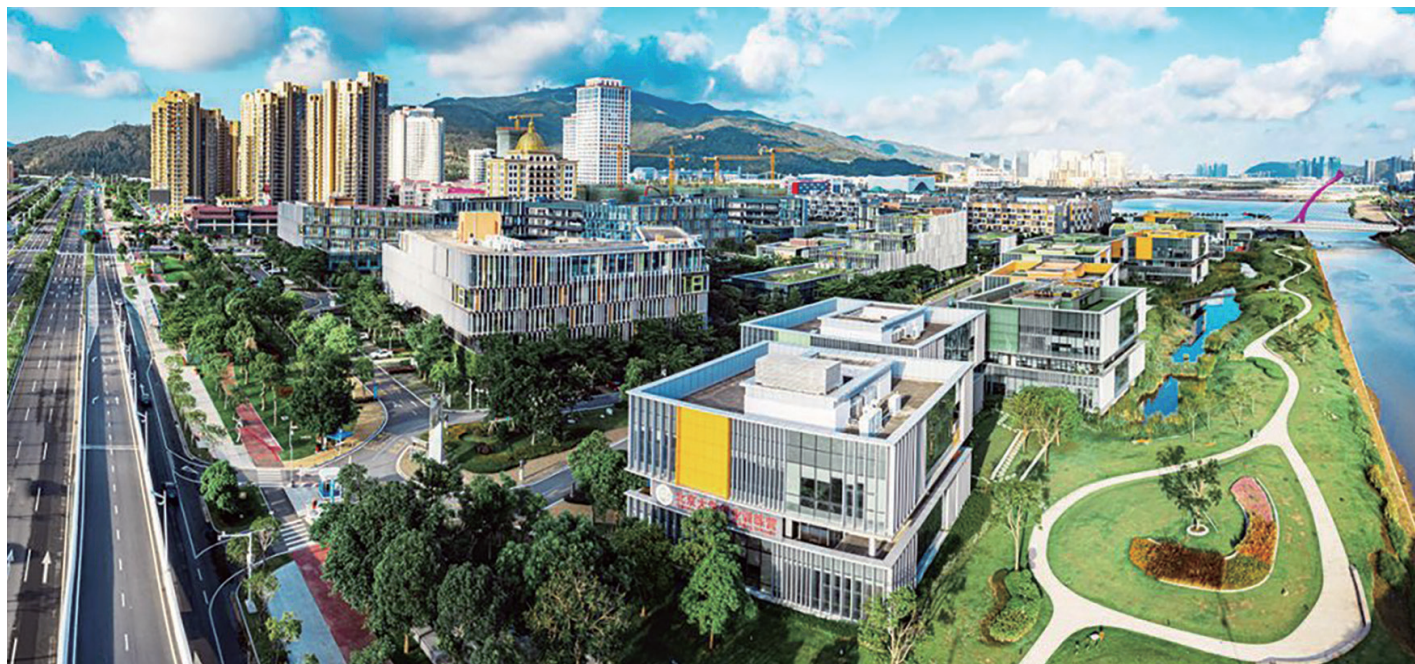
《監管辦法》總體思路為“一線基本放開、二線嚴格管住、區內實現自由”