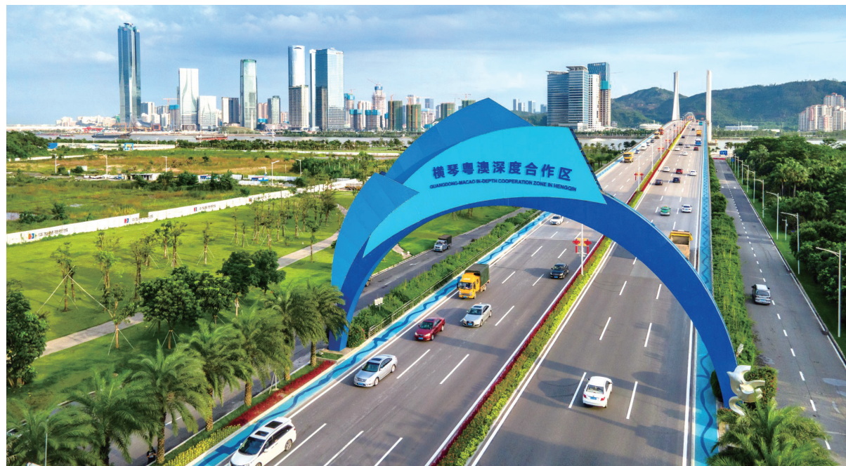
海關總署日前發佈關於《中國海關對橫琴粵澳深度合作區監管辦法》的政策解讀

現行規定向海關如實申報，接受海關監管。二是物品監管方面，明確進入內地的個人攜帶、寄遞進境免稅物品應當以自用、合理數量為限，按照國家有關規定實施稅收徵免管理。三是已按規定繳納進口稅收的貨物等國內流通貨物、物品，海關不實施監管。