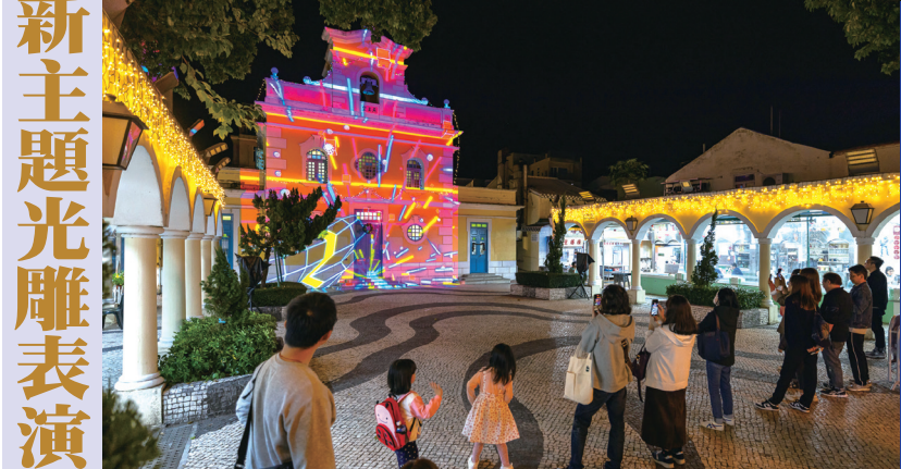
光雕表演各具特色

“2023幻彩耀濠江”的協辦單位包括：市政署、經濟及科技發展局、文化局、體育局、海事及水務局及澳門科學館，活動合作夥伴包括：澳娛綜合度假股份有限公司、美高梅、新濠博亞娛樂、金沙中國、永利渡假村(澳門)股份有限公司和銀河娛樂集團。