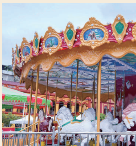
聖誕市集設有充滿聖誕氣氛的旋轉木馬嘉年華

提供予公眾遊玩。為減省輪候時間，旋轉木馬嘉年華及轉轉杯設施將提供派籌及網上預約取籌，另現場亦提供有少量名額。