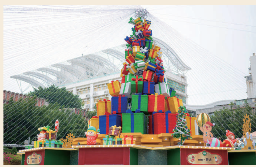
聖誕市集即日起一連十七日在塔石廣場舉行