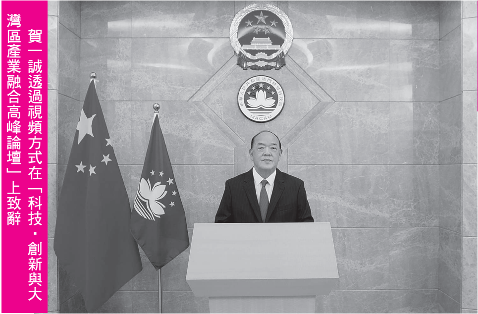
賀一誠透過視頻方式在「科技·創新與大灣區產業融合高峰論壇」上致辭。