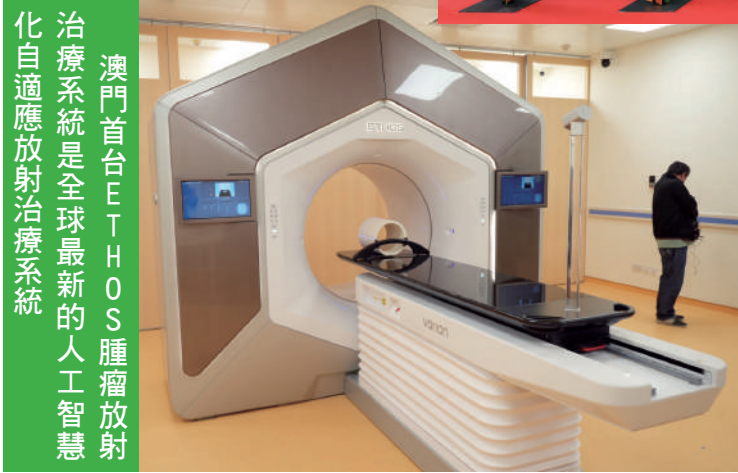
澳門首台PET-HOS腫瘤放射治療系統是全球最新的人工智能化自適應放射治療系統

【本報訊】澳門協和醫院試營運儀式於日前舉行，並將於明年9月16日正式開業。行政長官賀一誠表示，該醫院投入試營運，開創了澳門與內地合作辦醫的先例，標誌着澳門醫療事業開啟新篇章、新里程，彰顯“一國兩制”在澳門特區的成功實踐。該醫院將全面引進北京協和醫院的專家團隊、醫療資源等；致力提高澳門疑難重症及專科診治的能力，利用澳門在引進先進藥物和醫療設備的制度優勢，為居民和旅客提供更多就醫選擇。