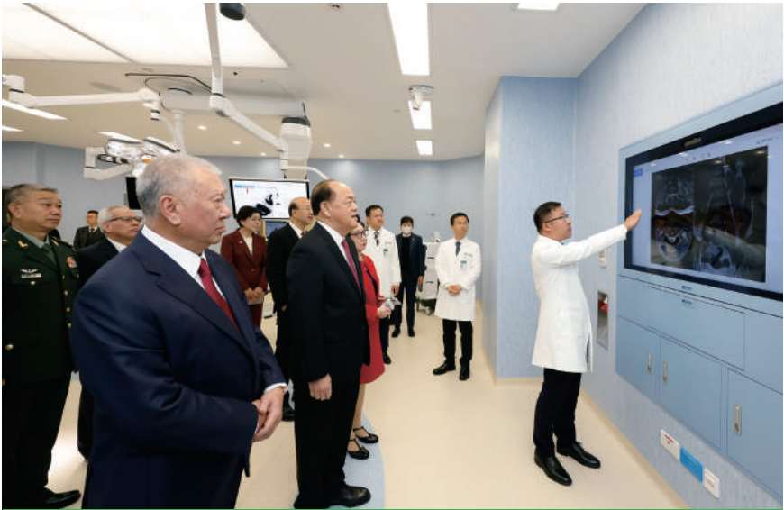
嘉賓參觀澳門協和醫院

至於原設在氹仔偉龍馬路科大醫院的仁伯爵綜合醫院離島急診站則於同一時間（昨日上午10時）停止接收掛號就診，在完成處理現場已掛號的就診者後，正式停運。