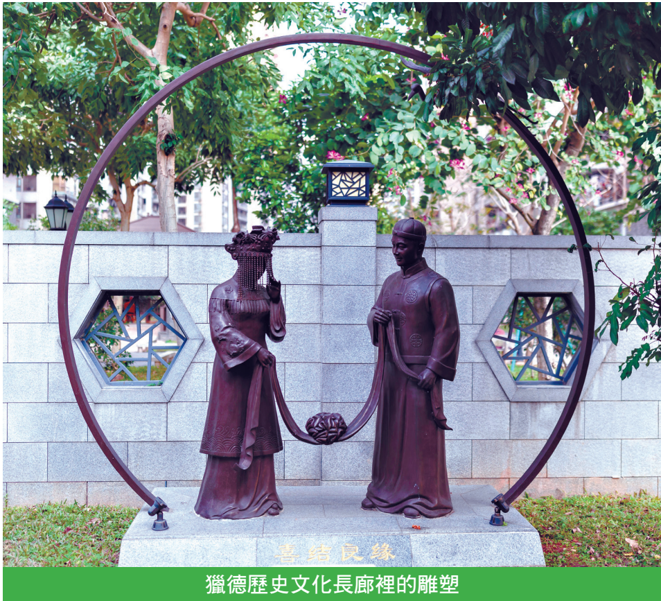
獵德歷史文化長廊裡的雕塑

獵德古村位於廣州大道以東、華南快速幹線以西、花城大道以南，毗鄰珠江，總面積約3.03平方公里。一條獵德湧（又稱獵水）穿村而過，將獵德分為東村和西村。