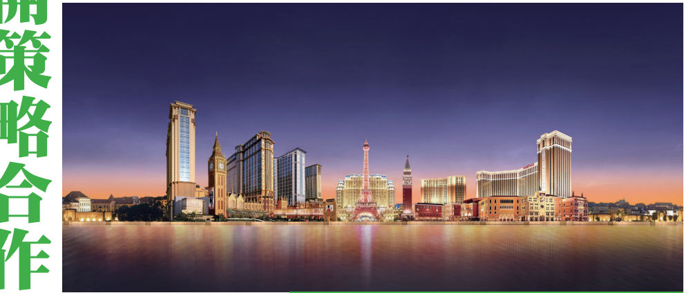
金沙中國與騰訊視頻及貓眼全面展開策略合作

此次的策略合作展現了三方長期合作的願景和共同發展的決心。金沙中國、騰訊視頻及貓眼將緊密合作，為訪澳旅客打造更多獨特而難忘的旅遊體驗，為澳門旅遊業的可持續發展做出積極貢獻。