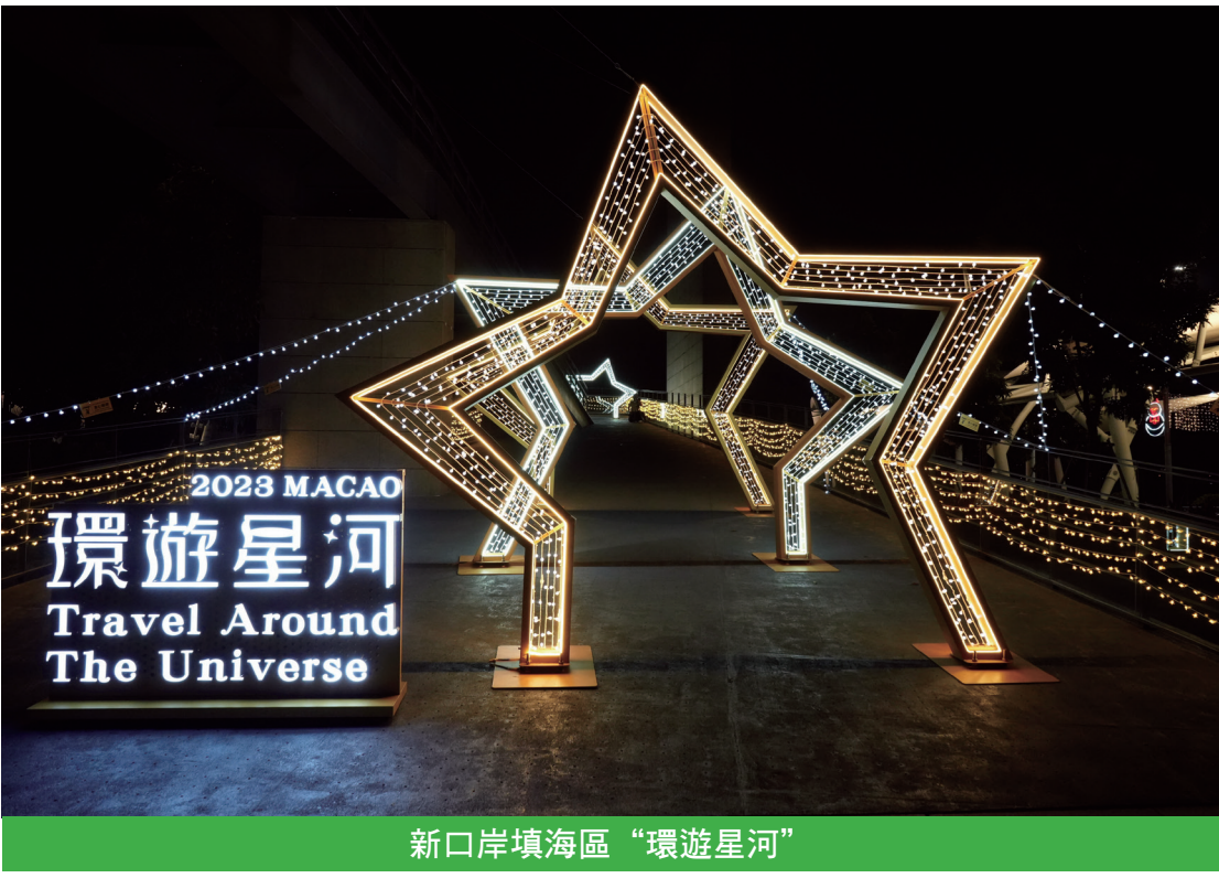
新口岸填海區“環遊星河”

章，集齊7個區份的印章可獲取手機支架乙個，同時參與幸運大抽獎。禮品數量有限，送完即止。旅遊局也在微信小程序“澳門旅遊局互動區”推出“2023幻彩耀濠江”互動遊戲，互動區提供今年活動的主題、路線圖及節目表等資訊；多個互動遊戲會陸續在互動專區推出，包括“我的幻彩記憶”、“我與澳門，耀一起”、“幻彩任意門”。以有趣的互動形式，吸引用戶從線上到線下深度參與，了解“2023幻彩耀濠江”的精彩活動內容，提升居民和旅客的參與度。