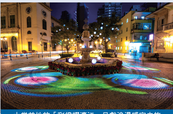
大堂前地的「彩燈耀濠江」呈獻浪漫感官之旅

為突顯新馬路金碧文娛中心豐富的歷史和文化，澳娛綜合以蘊含中華文化特色的霓虹招牌，傾力打造「懷舊澳門情」，與廣大市民和旅客喜迎新歲。金碧文娛中心門前亦將設置「繽紛人力車」，相互輝映，是拍照打卡的熱點。