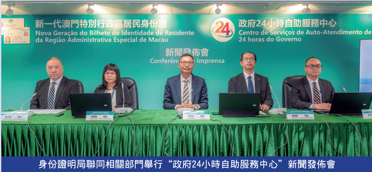
身份證明局聯同相關部門舉行“政府24小時自助服務中心”新聞發佈會

證件等的便捷體驗。身份證明局聯同相關部門日前在身份證明局二十樓舉行的新聞發佈會上介紹廿四小時自助服務中心，身份證明局局長周偉迎、身份證明局研究開發及檔案管理廳長曹偉健、市政署綜合服務及質量監察廳長何菁