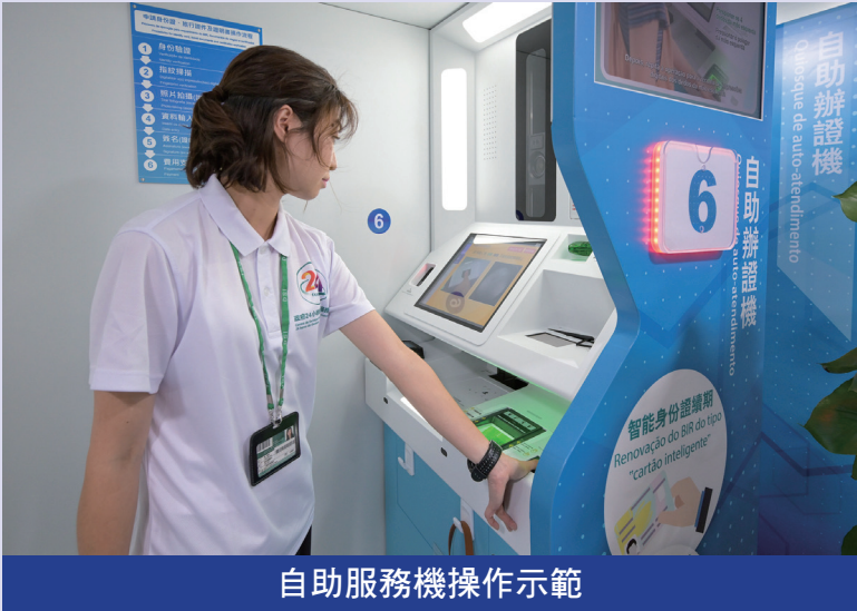
自助服務機操作示範