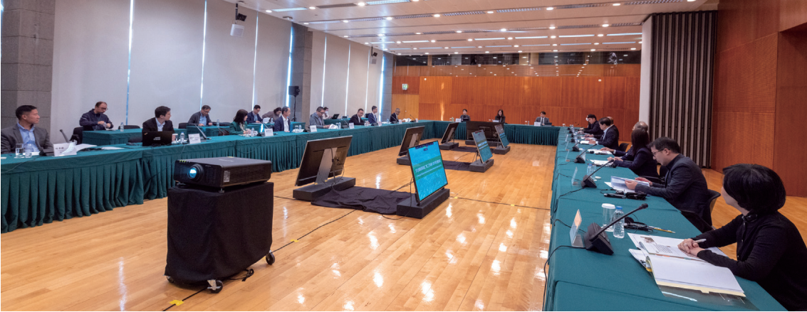
文化遺產委員會舉行平常全體會議

【本報訊】文化遺產委員會於日前召開本年度第六次平常全體會議，由社會文化司司長、文化遺產委員會主席歐陽瑜主持，文化局於會上向委員介紹澳門世界遺產展示館項目計劃及澳門世界遺產監測中心運作情況，並就有關被評定的不動產行使優先權事宜諮詢委員意見。