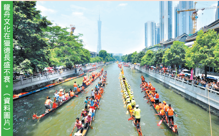
龍舟文化在獵德長盛不衰。（資料圖片）

在整村改造時，祠堂無法一一保留和重建，為了讓獵德宗祠文化得以傳承，獵德村在今獵德湧東岸，緊鄰獵德大道“獵德”牌坊異地重建祠堂區，形成今天的祠堂群。祠堂群主要由李、林、梁、麥四大姓氏的五座祠堂組成。正對獵德湧的一面是李氏大宗祠和李氏宗祠。居住在獵德湧兩岸的李姓，雖同姓李，但先祖來源地不同，就重新建了兩間李姓祠堂。