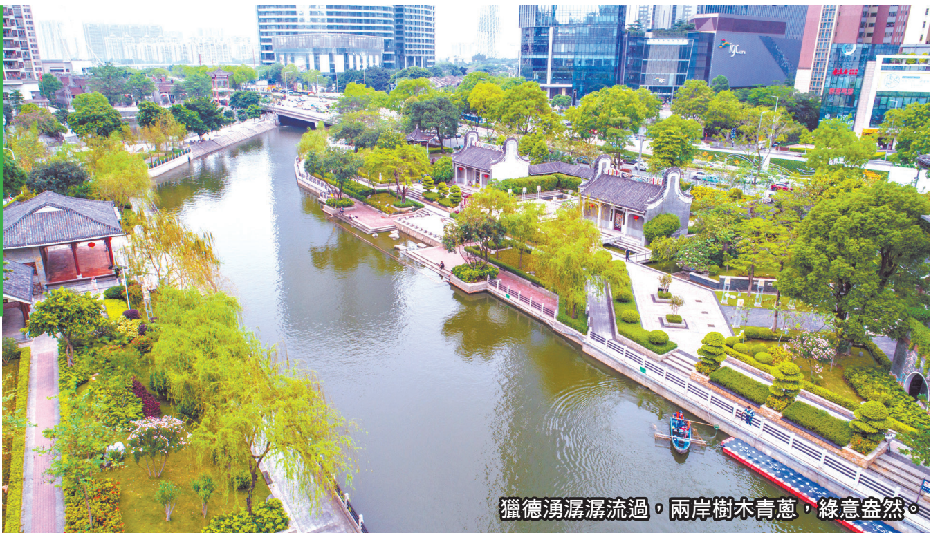
獵德湧湧流過。兩岸樹木青蔥，綠意盎然。

【轉自廣州日報】位於珠江之畔的獵德無疑是廣州新中軸線上一處獨特美麗的風景，集傳統與現代、富足與活力於一身。 獵德開村于宋代，已在江畔佇立了九百餘年，歷史底蘊深厚，文化源遠流長，是廣州老八區保存最完整的古村之一，有“嶺南周莊”之稱。 作為廣州率先整體改造的城中村，獵德經歷了從農田到新型社區的轉變。如今，蜿蜒的河湧、古樸的嶺南建築與珠江新城的現代氣質交相輝映，似有濃淡相間的筆墨，在這裡描摹下近千年滄海巨變的畫卷。