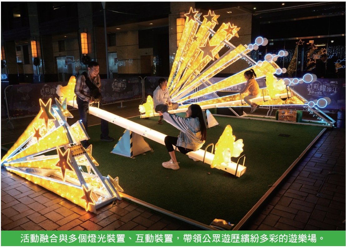
活動融合與多個燈光裝置、互動裝置，帶領公眾遊歷繽紛多彩的遊樂場。