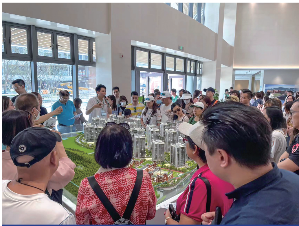
橫琴「澳門新街坊」住宅示範單位及樣板房累計近7,000參觀人次

「澳門新街坊」住宅示範單位及樣板房已於11月1日起對外開放參觀，目前都更公司並未開始住宅銷售，