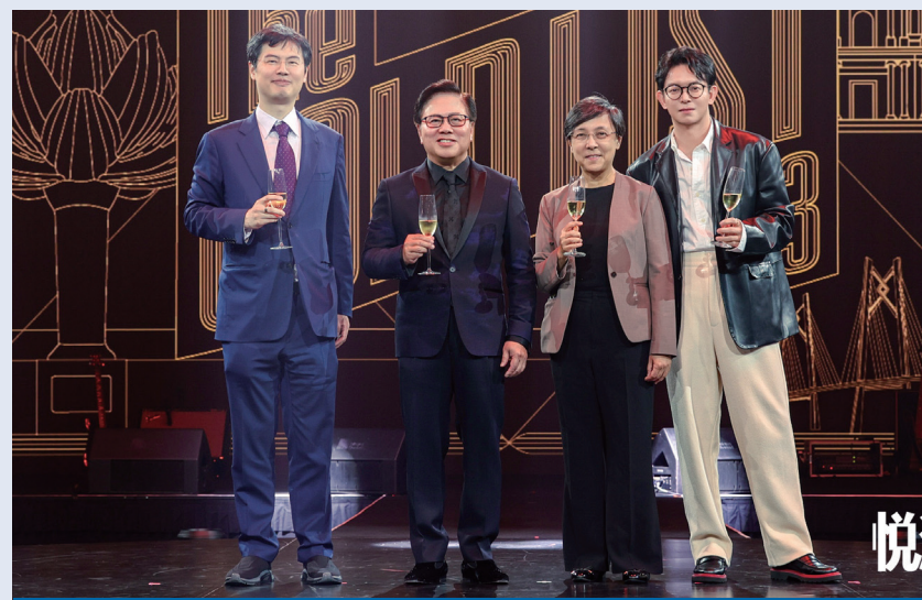
金沙旅享與《悅游Condé Nast Traveler》達成深度合作

《悅游Condé Nast Traveler》於2013年3月在中國創刊上市，以「旅行之真諦」（Truth in Travel）為宗旨，內容不僅包括旅遊目的地、酒店、美食與美酒、自駕、航空、旅行禮儀和商務旅行，也涉及行裝、購物、美容等與旅行生活息息相關的諸多方面，是中國高端旅行者的重要旅行指南。