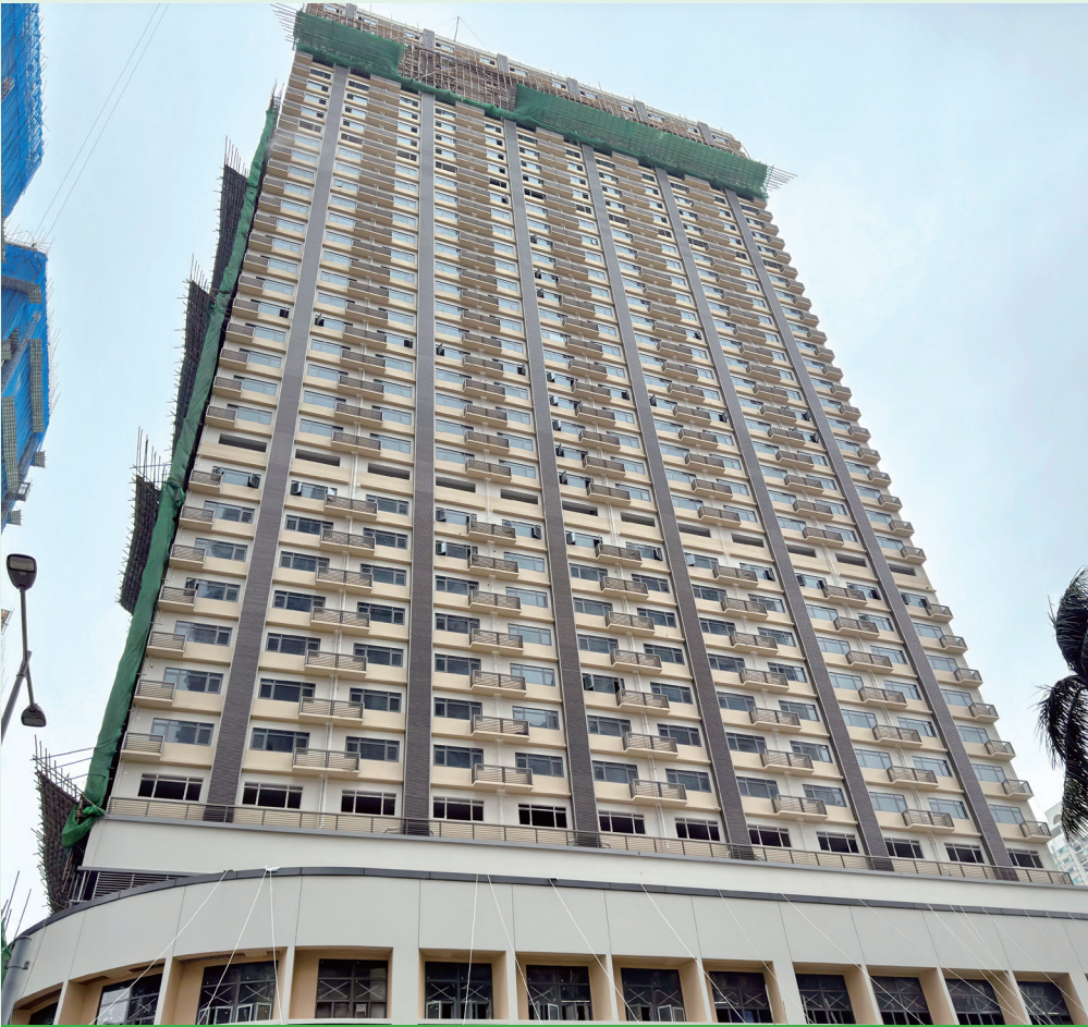
長者公寓首階段推出 逾七百個單位

【本報訊】政府長者公寓於本月6日開始接受申請，合資格者可透過線上方式或七十七個線下服務點提交申請。申請人必須為年滿65歲的澳門特區永久性居民，且具備居家生活自理能力。倘兩人申請共同使用同一住宿單位，其中一位申請人必須符合上述的資格條件；而另一位申請人須為年滿60歲的澳門特區永久性或非永久性居民，且具備居家生活自理能力。申請人現時獨居或取得澳門特區居民身份11年以上等，在評分準則作出加分安排。 公寓每一住宿單位的使用人數上限為兩人。申請人必須為年滿65歲的澳門特區永久性居民，且具備居家生活自理能力。倘兩人申請共同使用同一住宿單位，其中一位申請人必須符合上述的資格條件；而另一位申請人須為年滿60歲的澳門特區永久性或非永久性居民，且具備居家生活自理能力。兩位共同申請人之間的關係為夫婦、親屬或朋友等皆可。倘申請人的居家生活自理能力不足，經社會工作局確認在申請共同使用同一住宿單位的人或其他照顧者（如家傭）的協助下能夠居家生活，亦可提出申請。照顧者不具申請人的地位。 特區政府在評分準則作出以下加分安