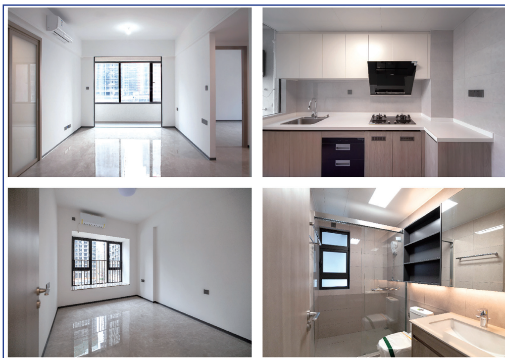
4,000多個交付標準住宅單位均配有精裝修

澳門都市更新股份有限公司屬於私法人，在橫琴粵澳深度合作區建設澳門新街坊項目，該項目配有衛生站、學校、長者