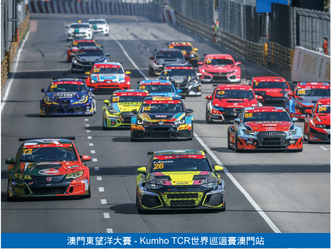
澳門東望洋大賽 - Kumho TCR世界巡迴賽澳門站