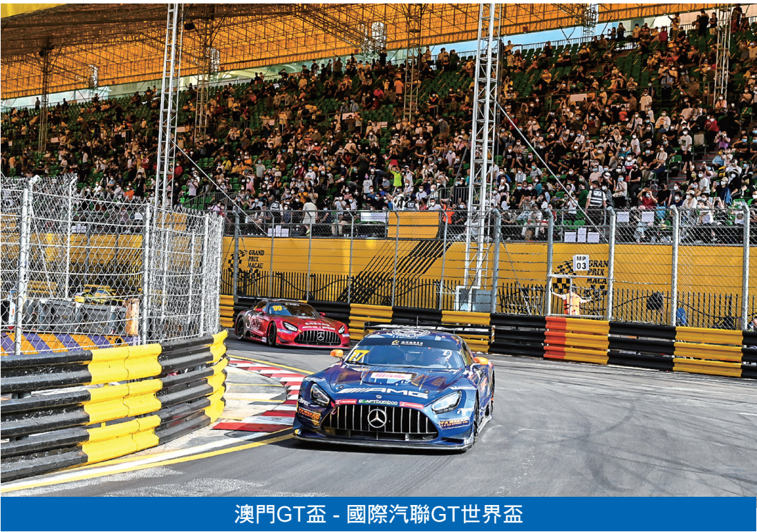
澳門GT盃 - 國際汽聯GT世界盃

【本報訊】市政署開放雀仔園街市五個攤位及沙梨頭美食廣場十個攤位作公開競投，截止投標日期為本月十六日，有意投標者須於當日下午五時前遞交申請表及競投計劃書等文件。 上述十五個街市攤位可供經營輕食、熟食、水產等十三類商品或菜式，每名競投者只可競投一個街市內一種業務類別的攤位。評審委員會將