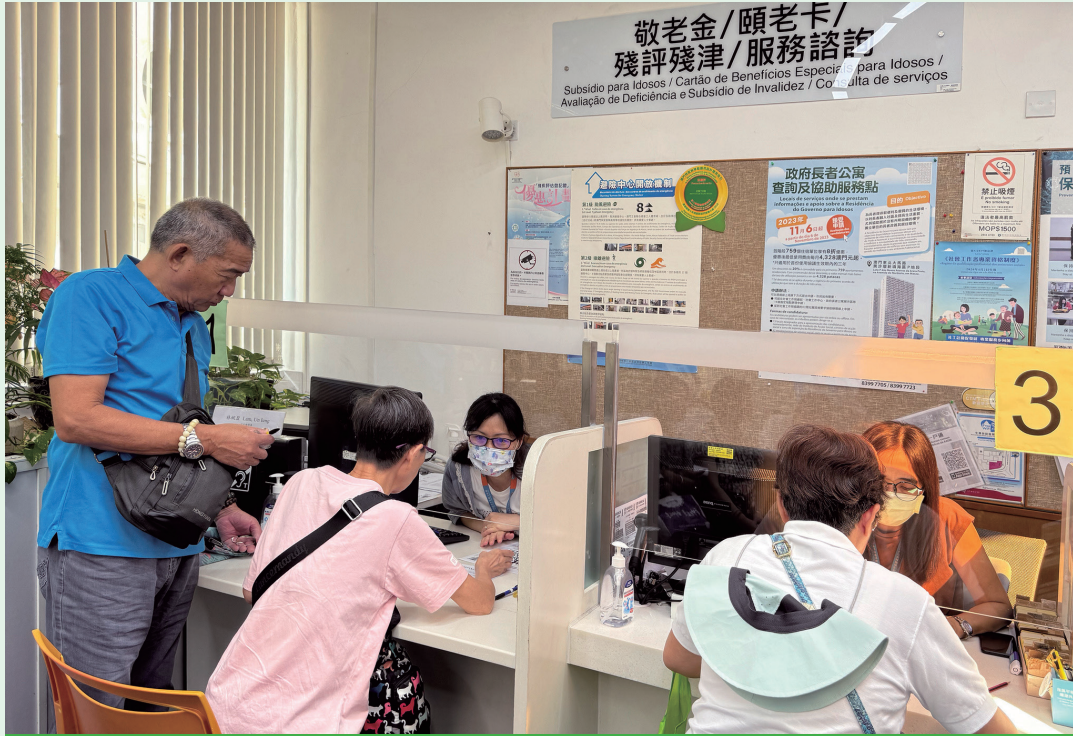
政府長者公寓接受申請，申請或查詢的市民眾多。

位於澳門俾利喇街望德樓三樓的「政府長者公寓展示區」將推出全新的展板資訊，內容包括：政府長者公寓的法規內容、申請要件、評分準則、使用費、申請流程、地理位置及配套设施等，展示政府長者公寓相關的詳細資料。特區政府期望透過展示區的示範單位、展板、展區及短片等資訊，增加長者和市民大眾對政府長者公寓的大樓、服務安排以及周邊配套等方面的了解。 「政府長者公寓展示區」於本月6日開放予市民親臨參觀及辦理申請。此外，展示區將會暫停團體預約導賞，敬請留意。