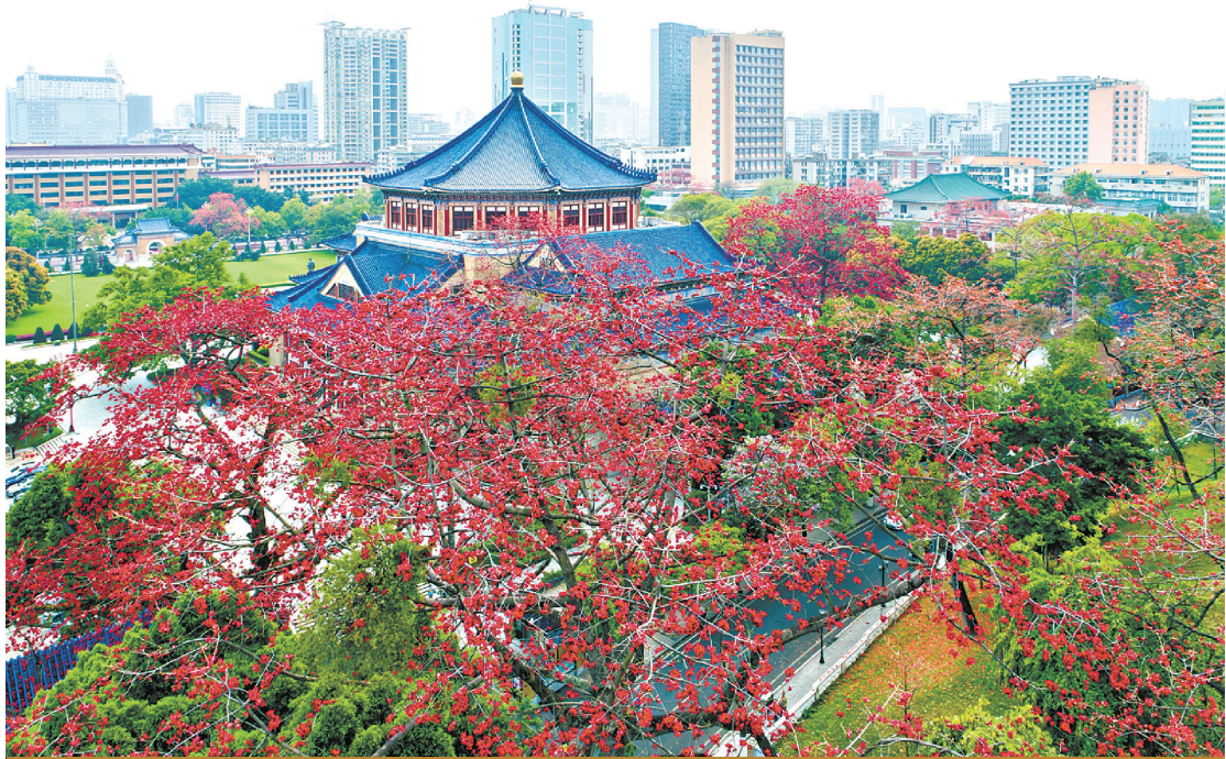
中山紀念堂的紅棉花盛放

在漫長的與木棉相伴的歲月中，嶺南人民發現了木棉花的妙用，成為嶺南家喻戶曉的中藥。當木棉花掉落地上，廣州的街坊會將其撿起、曬乾，然後用來煲湯、煲粥、煲涼茶，在濕熱的季節可以祛濕、清熱解毒。清代《學海堂志》所記“花開則遠近來視，花落則老稚拾取”的情景，講的就是這樣的廣州風俗。