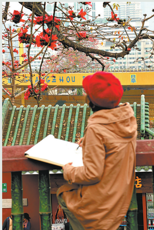
木棉花開，市民來到戶外寫生。