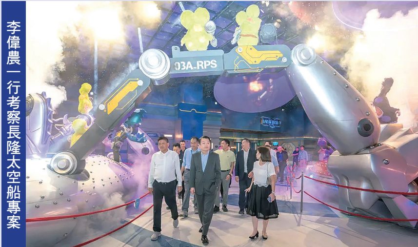
李偉農一行考察長隆太空船專案

橫琴粵澳深度合作區執委會主任李偉農一行日前考察長隆太空船項目，走訪“宇宙世界”“峽谷星球”“珊瑚秘境”“宇宙樂園”等4個主題區，並與長隆集團董事長蘇志剛、總裁龔良慶等相關負責人座談交流。