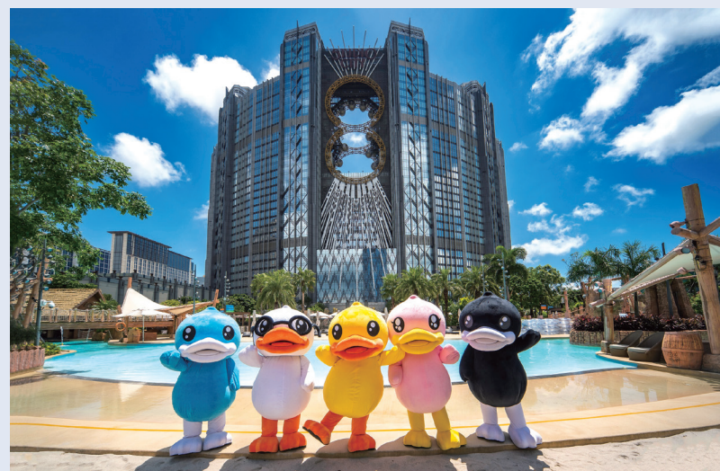
新濠影滙聯乘B. Duck市場推廣計劃榮獲2023年度亞太旅遊協會金獎

彰亞太地區傑出且創新的旅遊舉措。亞太旅遊協會金獎於1984年設立，為業界打造卓越成就和創新的基準，備受認可。