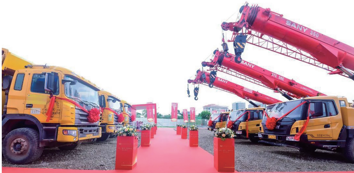
南光（橫琴）物流中心預計於2026年正式投入運營