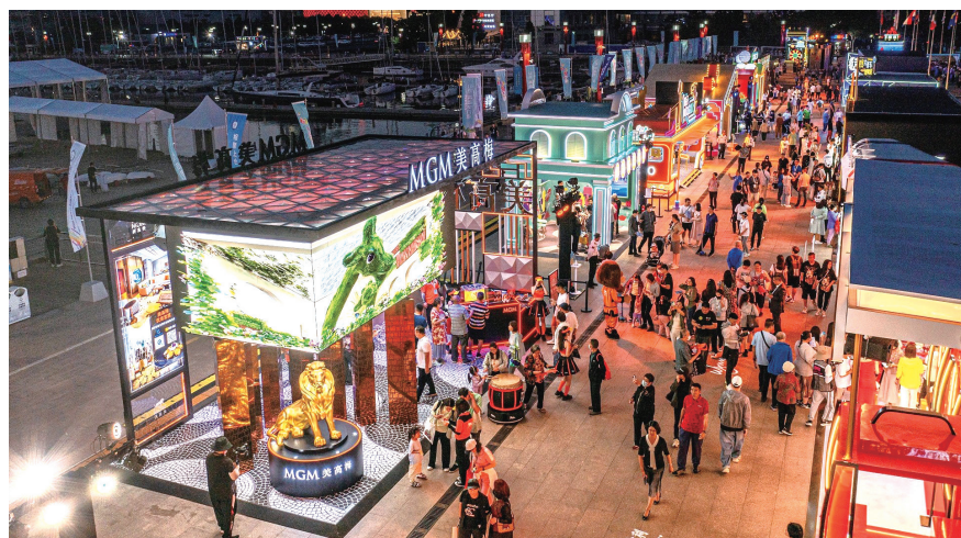
美高梅參與澳門特區政府在天津舉辦的「天津澳門周」大型路展

【本報訊】繼早前在內地各省市的「澳門周」大型路展取得空前成功後，美高梅於8月31日至9月4日參與特區政府於天津市和平路步行街（金街）舉行的「天津澳門周」大型路展。一連五天，以科技跨藝術的嶄新體驗，向天津居民展示澳門作為國際旅遊城市的形象和內涵。