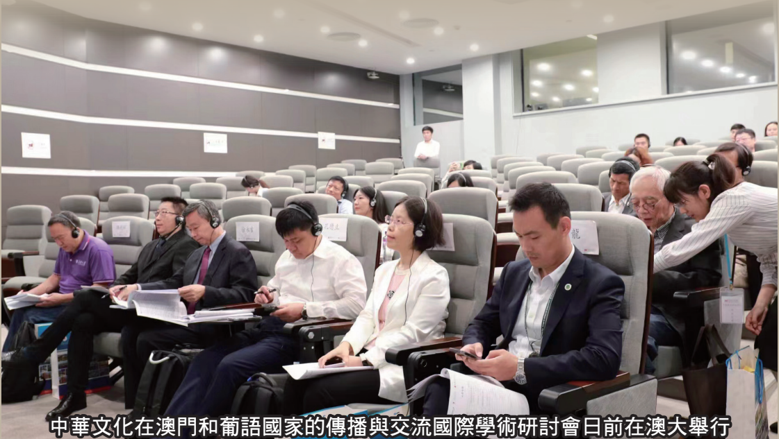
中華文化在澳門和葡語國家的傳播與交流國際學術研討會日前在澳大舉行