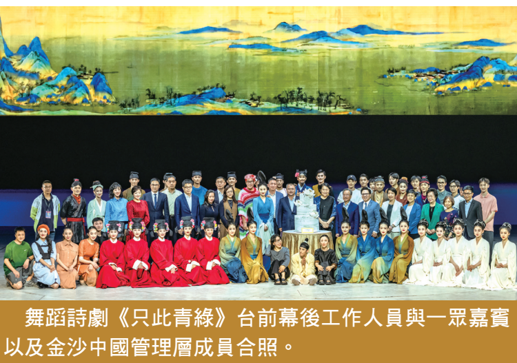
舞蹈詩劇《只此青綠》台前幕後工作人員與一眾嘉賓以及金沙中國管理層成員合照。

金沙中國有限公司總裁王英偉博士表示，澳門是嶺南文化重要的組成部份，與葡語系國家亦有深厚淵源，而金沙中國作為根植澳門二十載的綜合度假休閒企業，非常高興能透過「金沙中國表演藝術計劃」善用自身的軟硬件資源，從中國內地、歐洲、香港等地引入優秀表演藝術項目，持續促進澳門與外地的藝術交流，在推動藝術鑑賞的美學氛圍的同時拓展觀眾群，為本地文創產業發展奠定基礎。此外，亦藉外地頂尖藝術家蒞澳的難得機會舉辦交流活動，冀望擴大本地社區的藝文參與，從而鞏固澳門作為文化城市的國際形象。展望未來，公司將持續配合特區政府「旅遊+」、「文化+」及經濟適度多元等施政方針，帶來更多讓觀眾翹首以盼、耳目一新的世界級藝術項目，豐富本澳居民及旅客的綜合藝文旅遊休閒體驗。