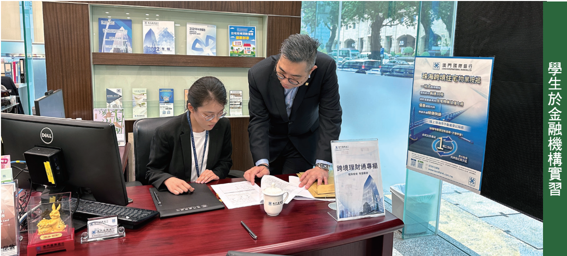
學生於金融機構實習

【本報訊】為培養現代金融所需的金融人才，澳門金融管理局聯同澳門金融學會及金融機構，自2018年起推出“大學生暑期實習計劃”，並於今年首次推出“金融人才培育先導計劃-財富管理”，為修讀金融、經濟或相關學科的在讀學生，提供暑期到金融機構實習的機會。其中，“金融人才培育先導計劃-財富管理”總結會於近日舉行，完成實習的學生均獲頒發證書。