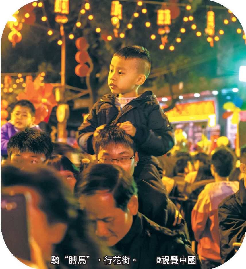
騎“膊馬”，行花街。