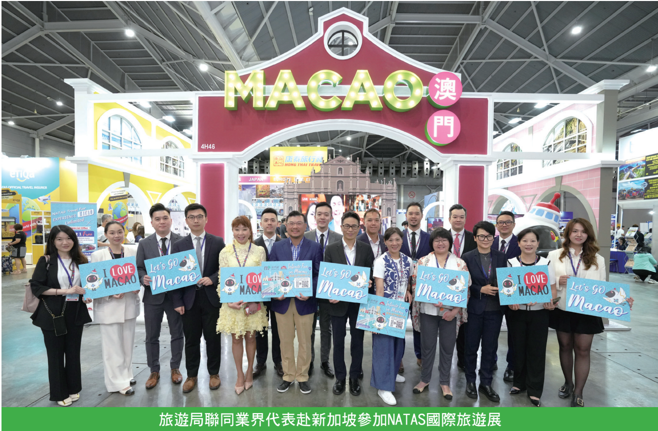
旅遊局聯同業界代表赴新加坡參加NATAS國際旅遊展

【本報訊】旅遊局聯同業界代表於8月11日至13日參加在新加坡博覽中心舉行的新加坡國際旅遊展（NATAS Holidays 2023），向當地居民推廣澳門多元豐富的“旅遊+”元素。期間舉行業界交流活動，着力吸引更多新加坡旅客訪澳，繼續全力拓展國際客源，促進澳門旅遊及經濟復甦。