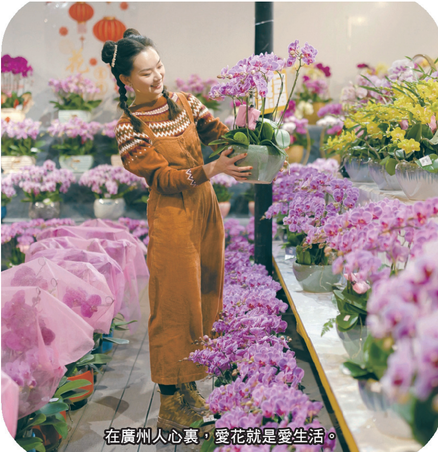
在廣州人心裏，愛花就是愛生活。