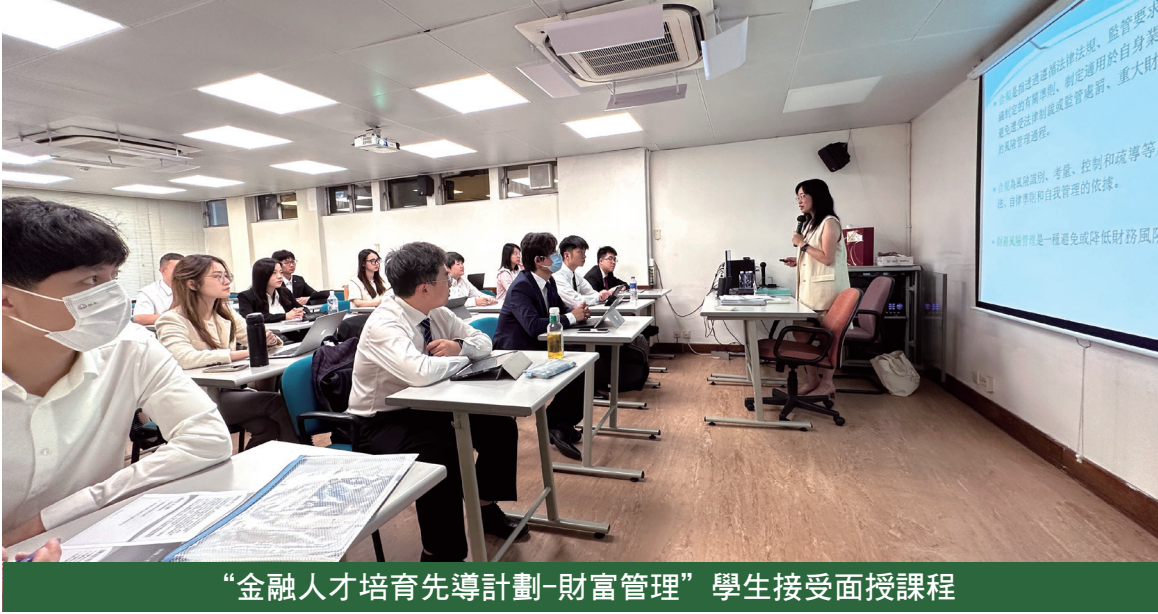
“金融人才培育先導計劃-財富管理”學生接受面授課程