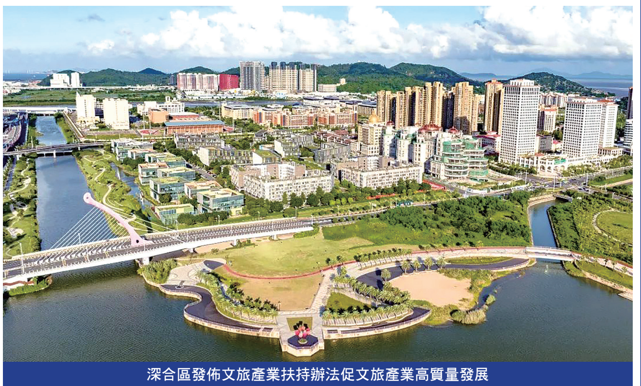
深合區發佈文旅產業扶持辦法促文旅產業高質量發展

水平建設橫琴國際休閒旅遊島，支持澳門世界旅遊休閒中心建設。根據《扶持辦法》，為加快促進琴澳資源分享，深化與澳門文旅產業合作，共同打造“一程多站”旅遊線路，對合作區內開發屬於“跨境一程多