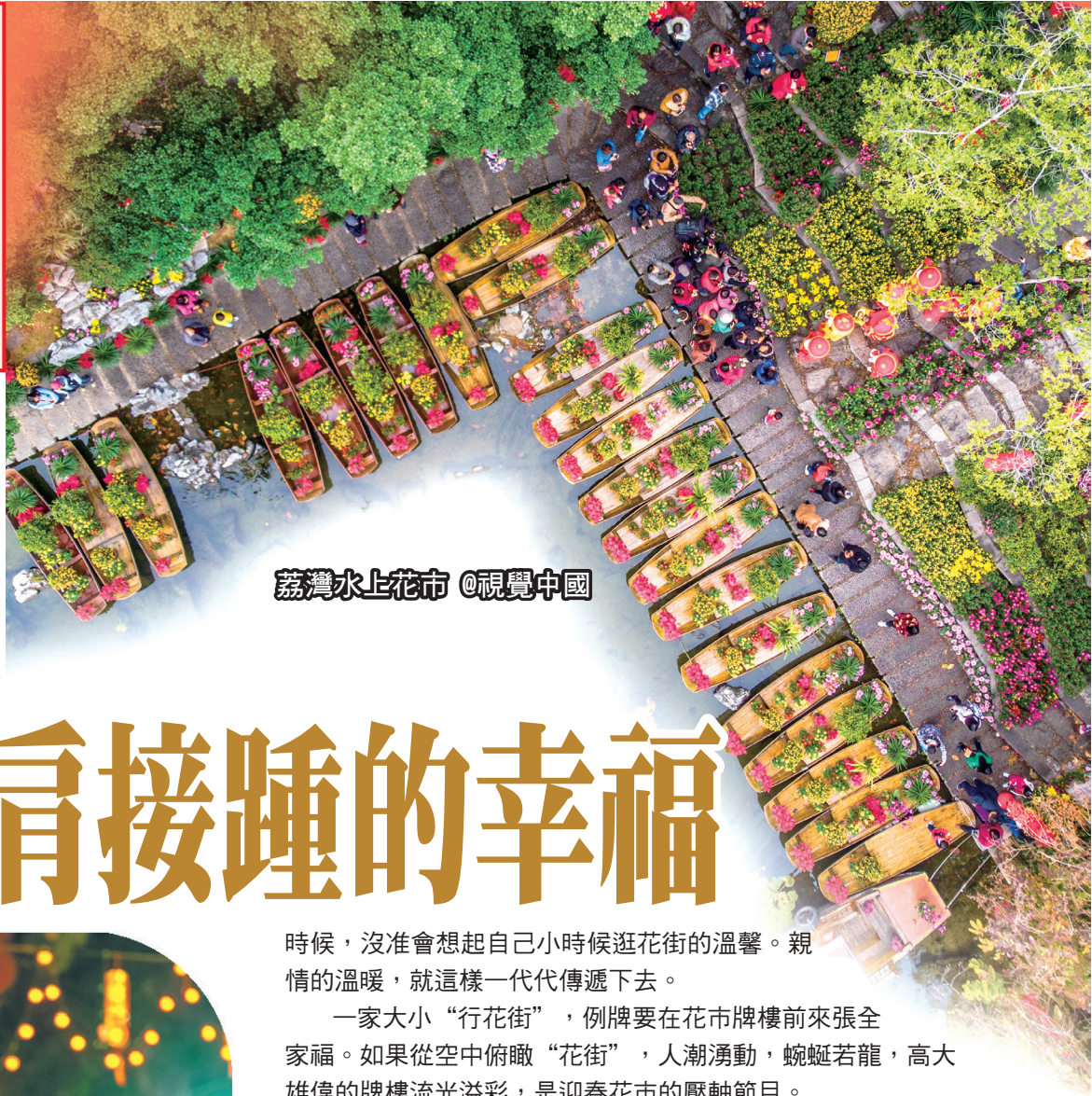
荔灣水上花市

“行花街”買花，買的是喜慶，送出的是祝福。不過，“花市”不止有花，花市是彙聚搭棚、燈飾、楹聯藝術與地方美食、工藝美術、民間文藝的大舞臺，是地方民俗文化的活態展示窗口，也讓更多人瞭解嶺南文化，享受廣式生活。