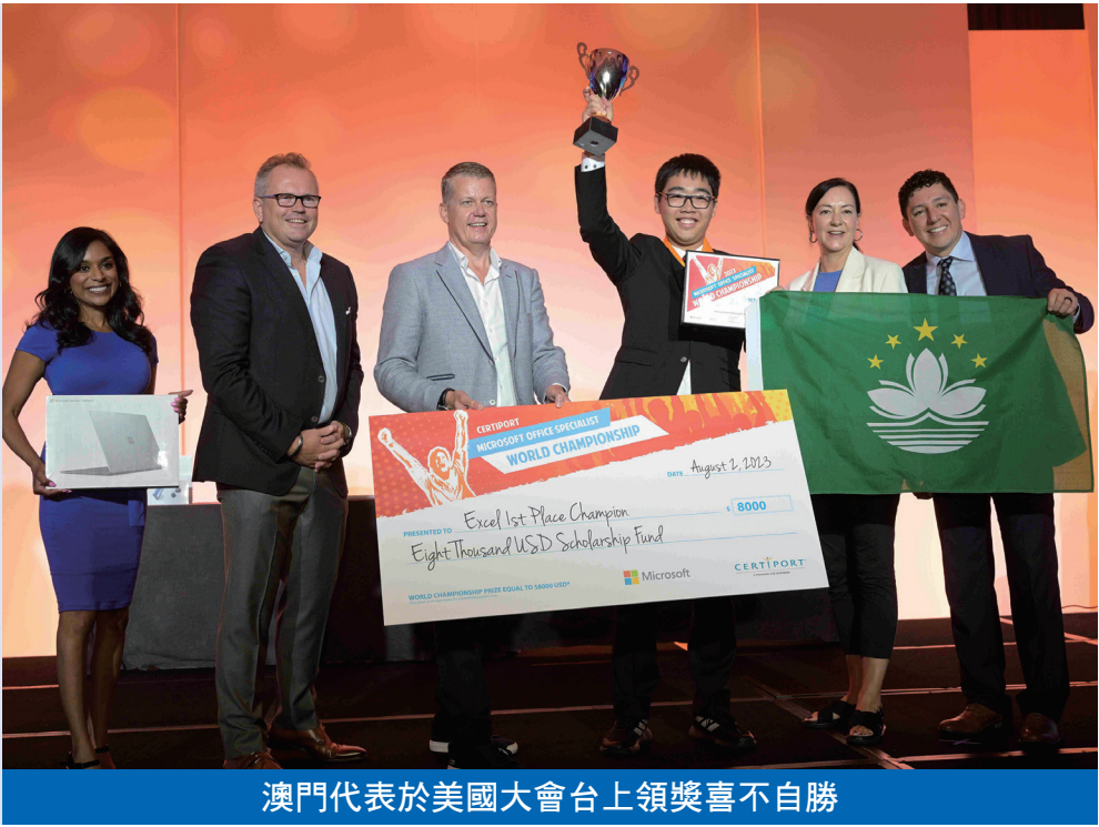
澳門代表於美國大會台上領獎喜不自勝

在今屆Microsoft Office軟件技能全球大賽，澳門代表取得歷年最佳成績，四項全球冠、亞軍，成績優秀。Microsoft Office軟件技能全球大賽項目包括Word、Excel、PowerPoint三個項目，每個項目分2016版及2019版；Adobe多媒體設計軟件技能全球大賽是用Photoshop、Illustrator、Indesign三個軟件作特定主題的海報設計。選手須按賽會的規定，在指定時限內應用有關軟件去完成一項符合商業客戶機構要求的作業。