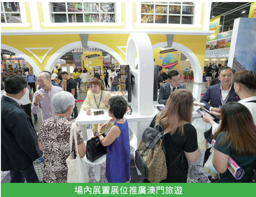
場內展置展位推廣澳門旅遊

旅遊展首日，旅遊局於展位舉行澳門與新加坡業界交流活動。兩地業者把握機會增進認識，拓展聯繫，探討合作，促使構思推出更多遊澳產品。