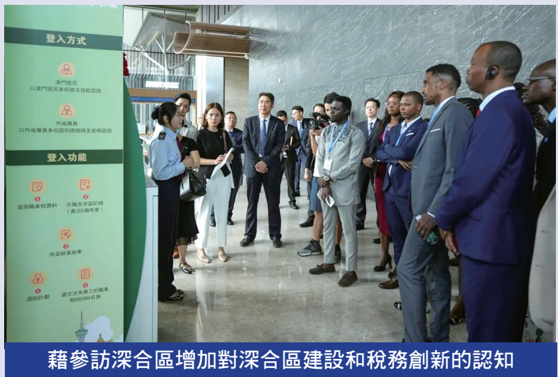
藉參訪深合區增加對深合區建設和稅務創新的認知