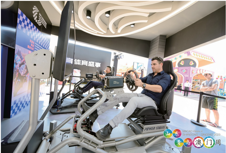
互動遊戲與眾同樂

由澳門特別行政區政府旅遊局、永利澳門及青島海爾洲際酒店合辦的“澳葡菜”傳承美食之魅推廣活動於6月8至15日期間於海爾洲際酒店品香苑自助餐廳舉行。除了精心烹調各款澳葡菜式，永利澳門三位主廚向當地廚師分享廚藝的心得，積極宣傳澳門“創意城市美食之都”的內涵。