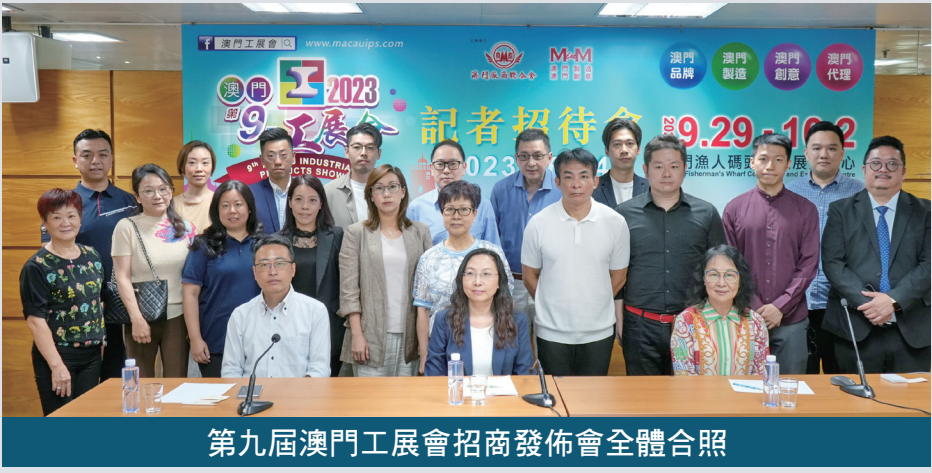
第九屆澳門工展會招商發佈會全體合照

展會將繼續設有澳門工業綜合館，於現場展示本澳工業的發展，貫徹工業教育的理念，並計劃於展會推出約兩百個展位，設有食品區、電器及家品區、時尚產品區、保健及嬰兒用品區及金融區。現場更有豐富精彩的舞台活動及親子同樂體驗，還有終極大抽獎及現場消費即獎活動。適逢國慶假期及週末檔期，配合特區政府“旅遊+”發展策略，為市民及遊客打造假期休閒熱點。