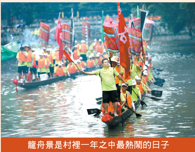
龍舟景是村裡一年之中最熱鬧的日子

一。每當一年一度的龍船盛景到來，波光粼粼的江河裡，水鄉兒女萬眾齊心，賽龍奪錦，既是寄託國泰民安、風調雨順的美好願景，又是一代代廣州人團結奮進、拼搏爭先的精神寫照。