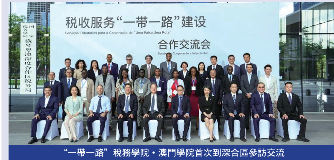
“一帶一路”稅務學院·澳門學院首次到深合區參訪交流

此次安排葡語系國家的學員到橫琴粵澳深度合作區實地考察，有助於了解中國稅務制度及徵管服務創新舉措的最新發展和實務應用，可藉此增加對深合區建設和稅務創新的認知。首次面授稅務課程的舉辦不僅為來自葡語系國家的稅務機關工作人員提供一個學習和交流的平台，也進一步促進橫琴粵澳深度合作區和葡語系國家之間交流，幫助其更好地了解中國稅收制度和徵管服務創新措施。對於學員日後的工作具有重要的參考價值，對促進國際稅務領域的合作和交流具有積極的推動作用。