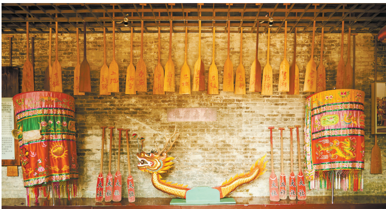
嶺南龍舟文化源遠流長，船頭、船尾、羅傘等都有講究。

《廣東新語》中有這樣的描述：“歲五六月間鬥龍船”，龍船“得勝還埠，則廣召親朋燕飲”。這種宴飲，珠三角人稱為食“龍船飯”。有些村一次“招景”龍舟多達六七十條，2019年農曆五月初三，從四鄉前來車陂“趁景”的龍船多達200多條，擺設數百圍宴席的“龍船飯”，熱鬧程度不亞於過年。趁景後的“龍船飯”是重頭戲，白切雞、燒鵝、鴻運燒肉、髮菜伴蠔豉等各色菜式令人垂涎。其中，最少不了的是一道簡單小炒——龍船丁，用豆角粒、辣椒圈、鹹蘿蔔、花生粒四樣材料炒制，可以幫助剛從河水中出來的龍船隊