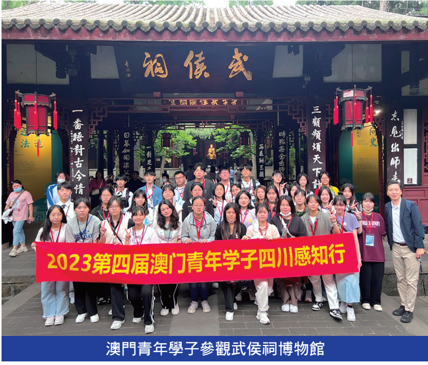
澳門青年學子參觀武侯祠博物館

學生感謝主辦單位精心安排內容豐富的活動，有學生表示這是很難得的機會，學習到很多課本以外的知識。學生普遍認為活動達到預期效果，不單擴闊了他們的視野，增進了對四川各方面的認識，更令他們深入了解內地升學環境及生活情況，對自身升學及生涯規劃也有裨益。