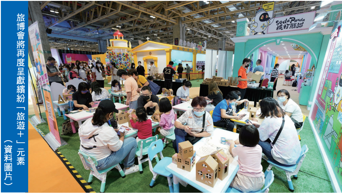
旅博會將再度呈獻繽紛「旅遊+」元素（資料圖片）

首設“1+4”展館助培有四大產業 首設“1+4”展館，組織大健康、現代金融、高新技術、會展商貿和文化體育四大重點產業的企業參展，並透過展示高新科技及智慧旅遊產品，以及舉辦“澳門國際健康管