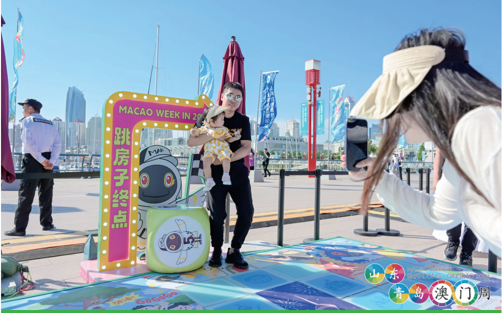
路展現場設置多個打卡點

“山東·青島澳門周”由澳門特區多個政府部門、企業機構和商會社團、青島市人民政府及山東省人民政府台灣事務辦公室等參與。預計今年稍後將於天津及廈門舉辦“澳門周”，持續利用線下宣傳活