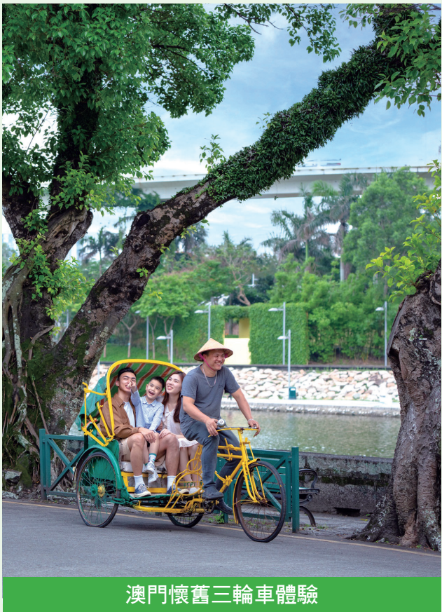
澳門懷舊三輪車體驗

店更是這座繁華小城中的世外桃源，是一個私隱度高且景致優美的休閒放鬆之地，搖曳生姿的樹影映照著五個戶外游泳池，可與孩子們在池中暢泳戲水，或是在草坪自由奔跑，享受被大自然包圍的親子時光。