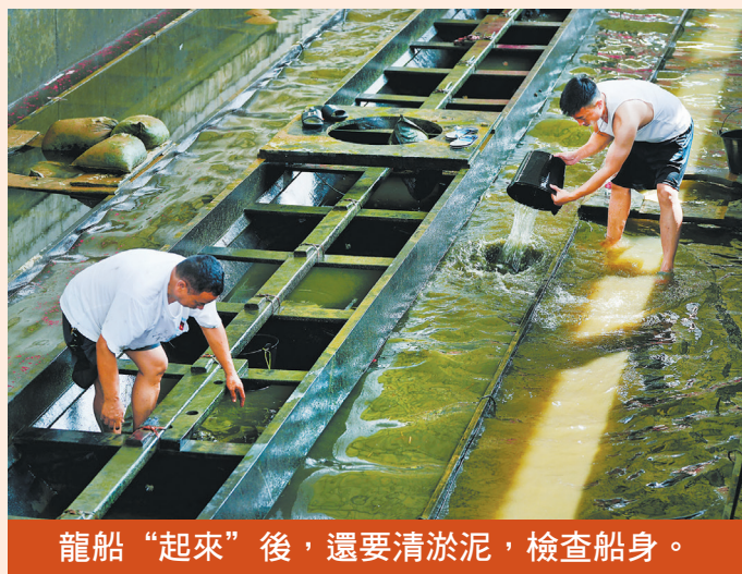
龍船“起來”後，還要清淤泥，檢查船身。

【轉自廣州日報】廣州水網密佈，百餘條河湧串起各大村落，廣府人生於水邊，長於江岸，龍舟競渡至少有上千年的歷史，是嶺南地區最具傳統特色、最具大眾參與性、最具傳承發展性的大眾文化之一。