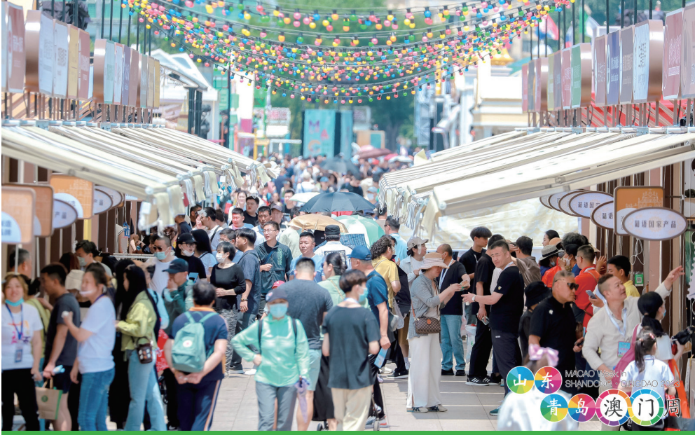
多個展位吸引大批遊人駐足

“澳門旅遊推介洽談會”及“青澳會展及貿易投資推介會”日前亦分別舉行，兩場活動共有約250人出席。會上積極介紹澳門旅遊最新狀況、盛事活動及新興旅遊產品和澳門及橫琴粵澳深度合作區投資環境以及會展資源等，讓兩地業者交流洽商，推動彼此間的合作。